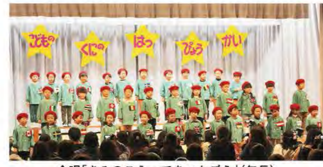
合唱「きみのこえ・てをつなごう」(年長)

舞台では、緊張しながらも一生懸命にダンスや劇、合唱などを披露しました。年少から年長まで、それぞれの個性が輝いていた発表会でした。