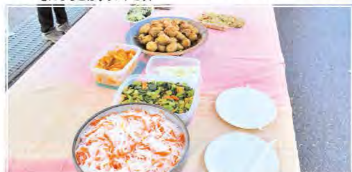
出荷者自慢の味も大好評

なかじま産直館 KIRASSHE(きらっしえ)にお越しください なかじま産直館KIRASSHE(きらっしえ)では、新鮮な農産物や加工品など、魅力あふれる中島村産の産品を各種取り揃えています。ぜひお気軽にお立ち寄りください。 ▼営業時間 9時～17時 ▼定休日 毎週水曜日(祝日の場合は翌日)、年末年始 出荷物の内容やその他お問い合わせについては、次とおりです。また、村ホームページもご覧ください。 問 なかじま産直館KIRASSHE(きらっしえ) ☎5213434 ▼インターネットでの検索 中島村ホームページトップ ↓観光情報↓特産品↓農産物の直売所 なかじま産直館KIRASSHE(きらっしえ)