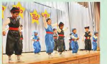
ダンス「忍者ハットリくん」(年中)