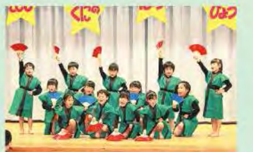
ダンス「ハダシの未来」(年長)