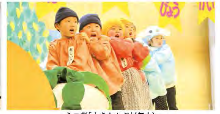
ミニ劇「大きなかぶ」(年中)