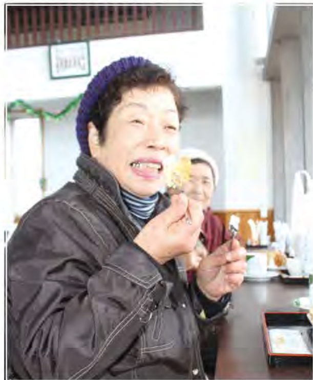
ふわふわシフォンケーキをいただきます!