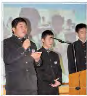
成果を報告する生徒

生徒からは、「最初は不安もあったけど、違う文化に触れることができ大変良い経験になった。『これからも英語の勉強を頑張り、国際的な視野を持って頑張っていきたい。』などの感想が聞かれました。生徒の皆さんは初めての海外体験に大きな意義を感じていた様子でした。