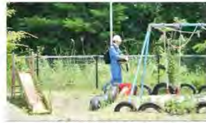
※線量測定状況イメージ (村内ではありません)

現在、村の南半分の地区の「生活圏の森林除染」を実施しておりますが、来年度に残りの地区を実施するため、環境省に委嘱された除染活動推進員が、事前に林縁の空間線量を測定します。なお、対象となる地権者の方に対し「同意書」を送付し、同意を得てから実施いたしますので、ご理解とご協力をお願いいたします。また、調査にあたり、立ち会いや調査費用等のご負担はございません。