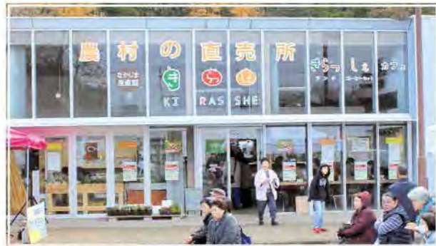
今年オープンした直売所KIRASSHE(きらっしえ)

来場者からは「ユーモアがあり大変面白かった。『日本人として逆に教えられることが多かった。』などの感想が多く聞かれました。