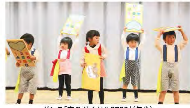
ダンス「恋のダイヤル6700」(年少)