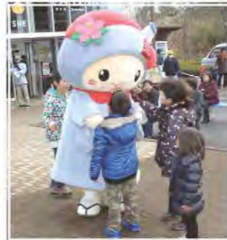
なかじぞうさんも登場!