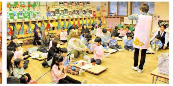
しっかりと歯磨き！