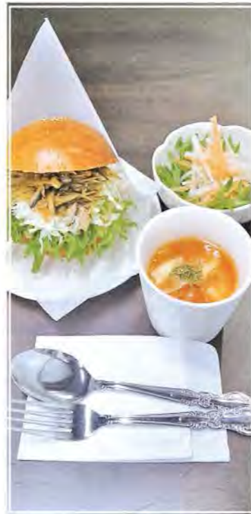
歯ごたえ抜群! きんぴらごぼうサンドセット