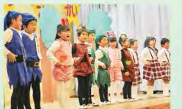
劇「金のおの銀のおの」(年長)

園児たちがかわいく元気に劇やダンスを発表！観覧に訪れた保護者の皆さんから大きな拍手が送られました。