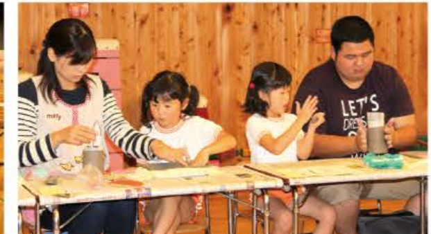
パパ・ママと一緒にチャレンジ