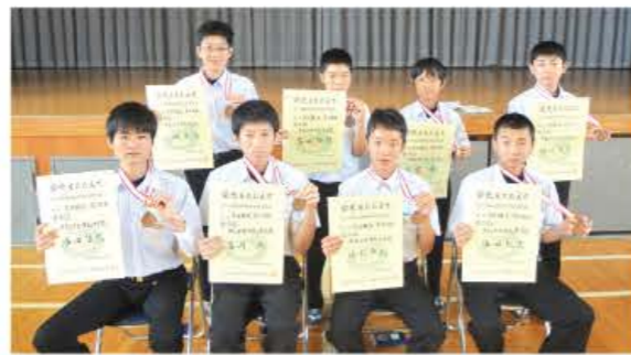
3位入賞おめでとう!