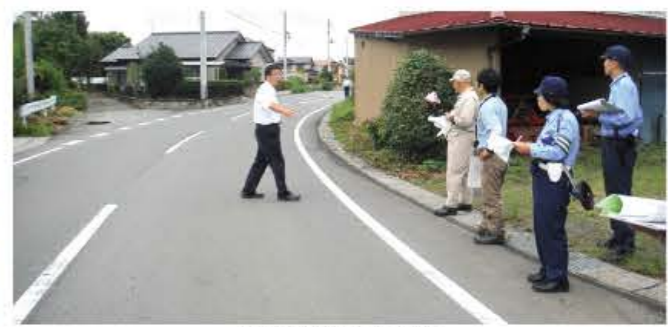
危険箇所等を確認

8月27日(木)に小・中学校 の通学路合同安全点検を実施 しました。 今回の点検では、昨年要望 した箇所への進捗状況の確認要 望箇所の把握をしました。 昨年要望した箇所では、道 路への路面標示の設置や白線 の引き直し等対応が進んでい る箇所がありました。 点検後は、輝ら里で協議会 を開催し、今後の対応につい て話し合いをしました。 会議には、福島県南建設 事務所や白河警察署をはじめ 村住民生活課、建設課と教育 委員会、各小・中学校など10 人が参加しました。 要望箇所には信号機の設置 等すぐに対応ができない箇所 もあります。通学路を走行す る際には、安全な運転をする よう心がけましょう。