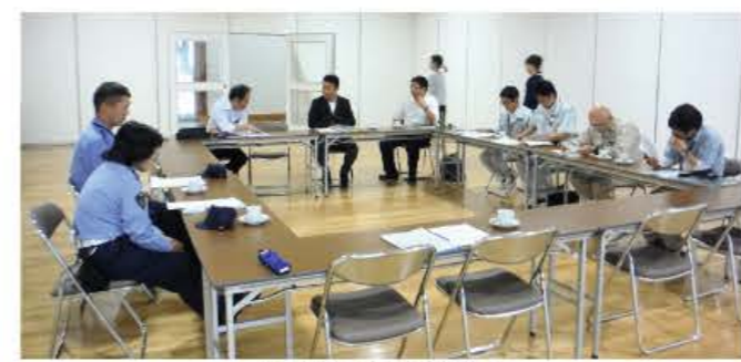
協議会で対応を検討