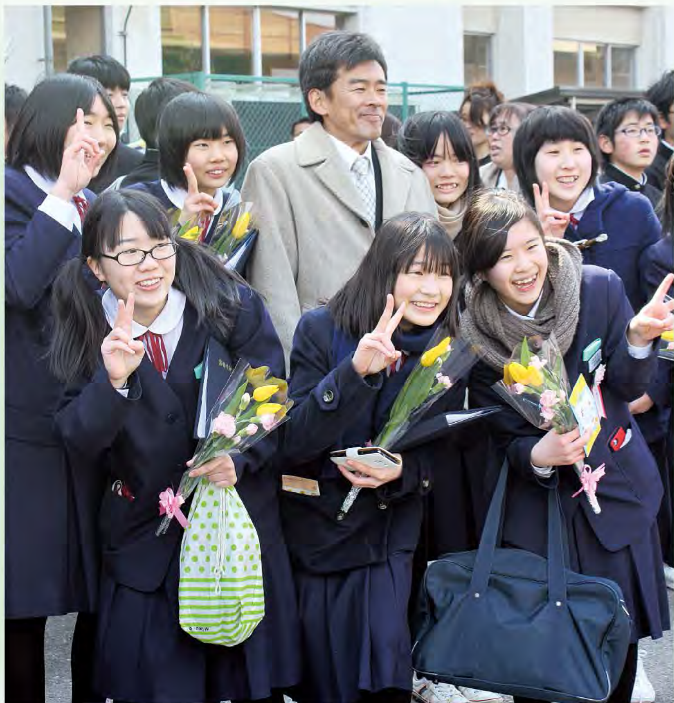
笑顔で旅立ち 中島中学校卒業式