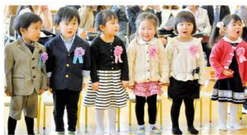
3月14日(土) 中島保育所 男児9名 女児7名 計16名 ※ぺんぎん組