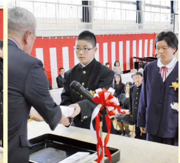
3月23日(月) 吉子川小学校 男子21名 女子9名 計30名