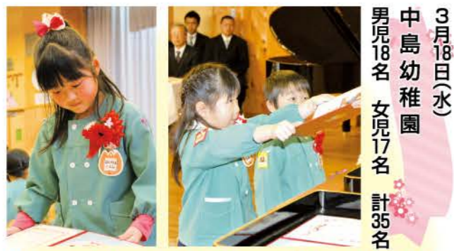
3月18日(水) 中島幼稚園 男児18名 女児17名 計35名