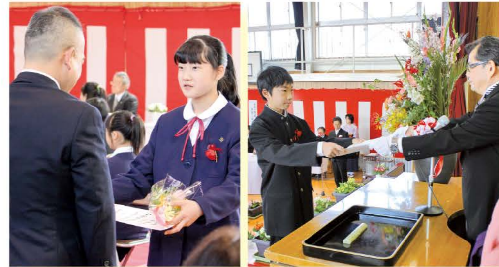
3月23日(月) 滑津小学校 男子14名 女子14名 計28名