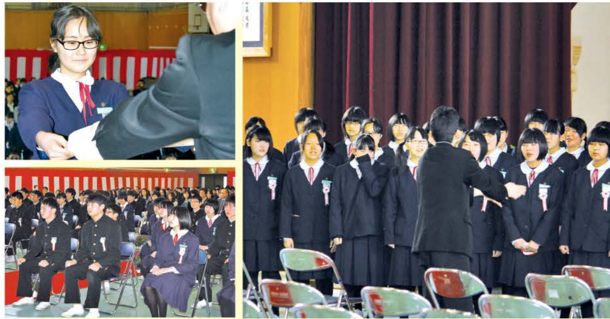
3月13日(金) 中島中学校 男子33名 女子30名 計63名