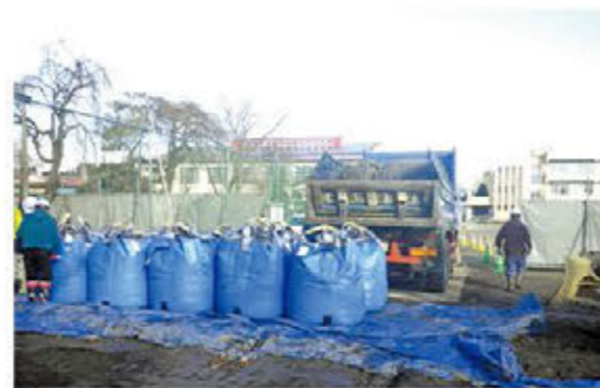
中島中学校から搬出する様子