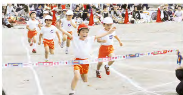
全力ダッシュだ！ゴーゴーゴー!! (年中)

さわやかな秋晴れの下、子ども達の一生懸命な演技に、たくさん声援と拍手が送られました。