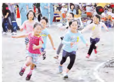
レッツゴー！1ねんせい (卒園児)