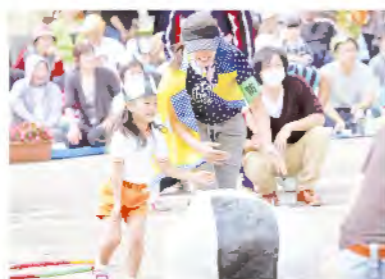
おむすびころりん 親子でゴー！ (年少親子)