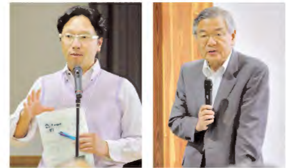
小山教授による総評