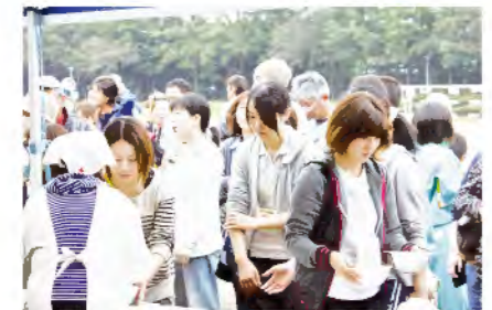
日赤奉仕団のおにぎり・豚汁に大行列!