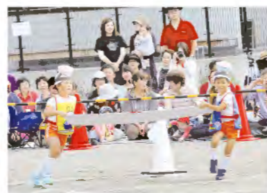
ラーメンー丁レース (年長)