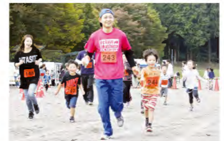
親子なかよくゴール!