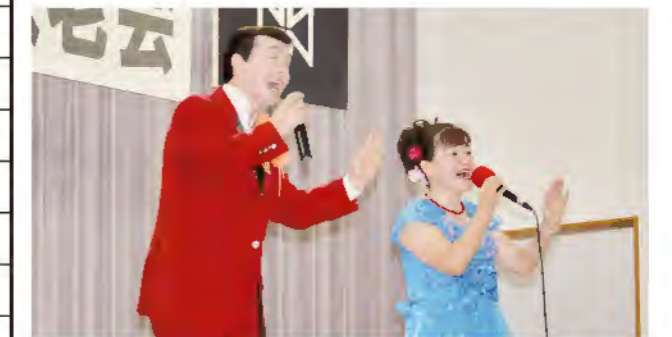
泰楽五郎歌謡ショー