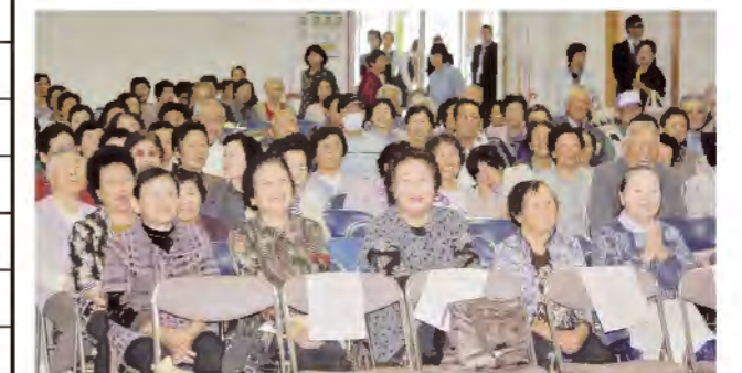
みなさんまだまだ元気です!