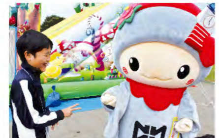
勝てるかな? なかじぞうさんジャンケン大会