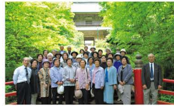
素晴らしい風景を堪能することが出来ました。

クラウン大学第2回講座は31名の学級生が参加し、隣県でありながら意外と訪れる機会が少ない栃木県大田原市での研修でした。本村吉岡の四徳田古墳から出土した短甲が日本最北のものとして有名になりましたが、それ以前に短甲が発見された岩舟台遺跡を始め、多くの古墳が見られる湯津上地区を最初に訪れました。中でも代表的な侍塚古墳の近くにある大田原市「なす風土記の丘湯津上資料館」を見学し、館長さんの丁寧な説明のあと、那須国造碑などかつての那須の国の貴重な文化財や遺跡などの展示品を見る機会に恵まれました。次に訪れたのは臨濟宗の名刹「雲巖寺」。俳人松尾芭蕉が立ち寄った名高い寺で朱塗りの反り橋や、山門に続く石段を登りました。新緑に囲まれ