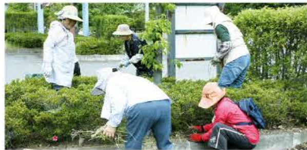
脳力アップ教室の自主化グループ「花みずき」

「花みずき」は、平成25年度の脳力アップ教室プログラムを終了したメンバーが、引き続き認知機能の向上を図るため、自主化したグループです。メンバーは休憩をはさみつつ、草むしりを精力的に行いました。