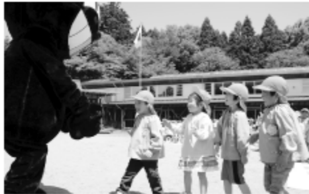
(交通安全教室で登場したクロネコの着ぐるみに大喜び)