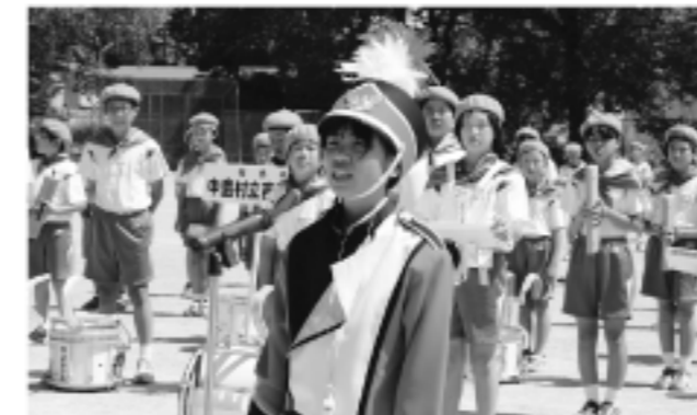
(交通安全・防犯パレード)