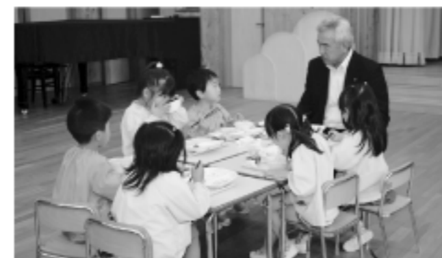
(JAしらかわから贈呈のブロッコリーを給食で試食)