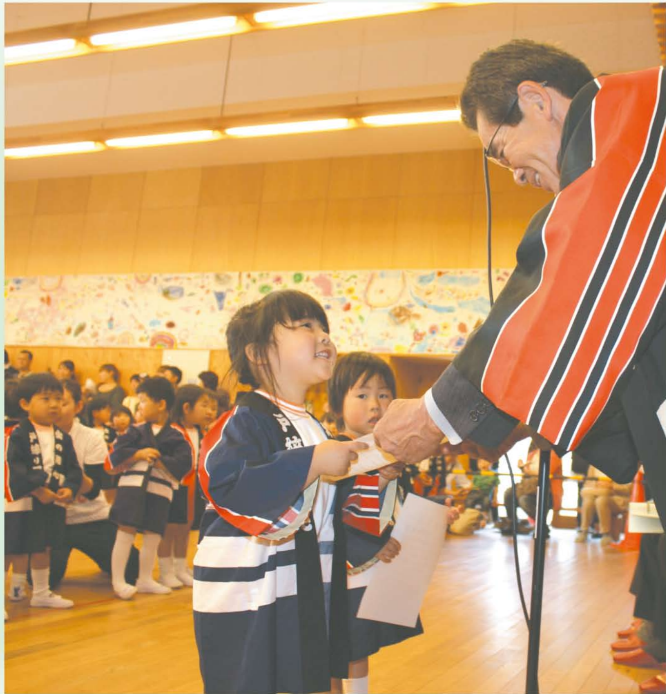
かわいい消防クラブ員が誕生 幼年消防クラブ入団式