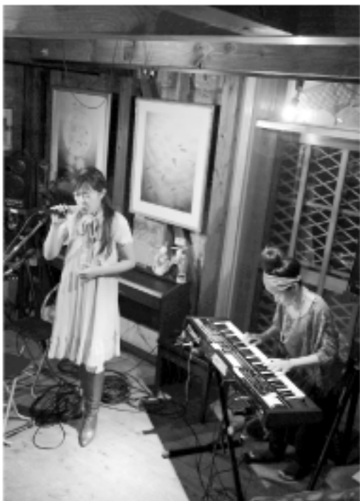
演奏予定のレッド・ベコーズ