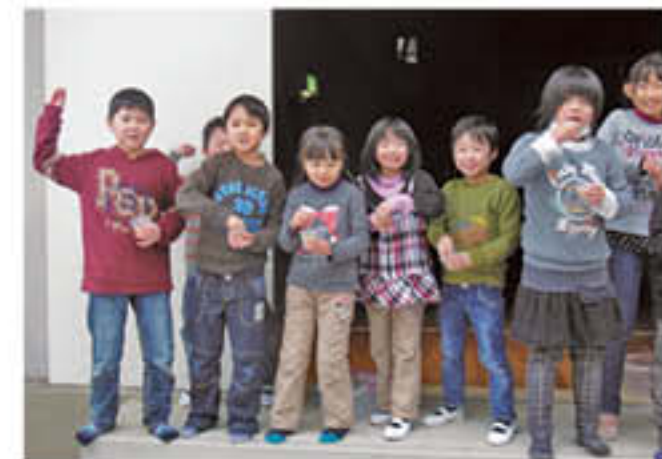
放課後児童クラブ