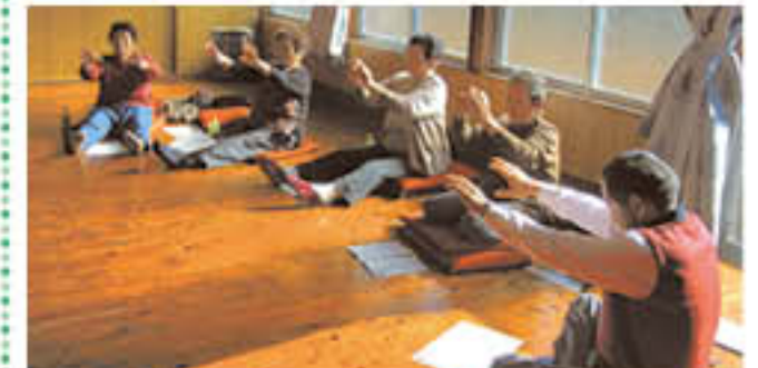
浦原ふれあいサロンの様子