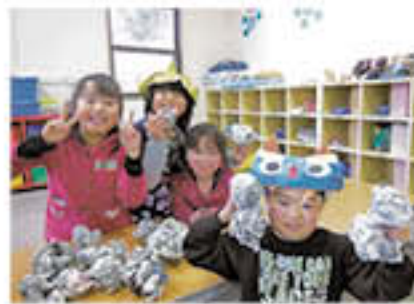
児童クラブ豆まき