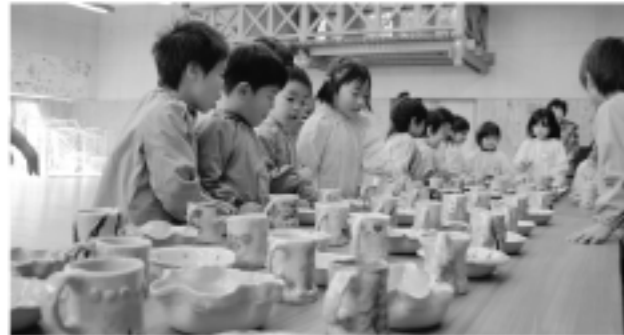
世界にたった一つだけのカップとお皿が完成 (幼稚園陶芸教室)