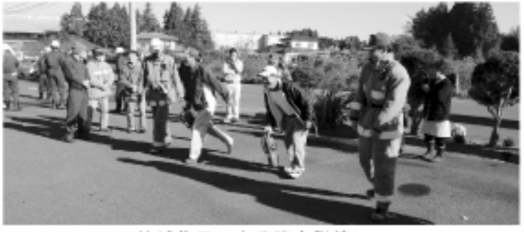
地域住民による消火訓練