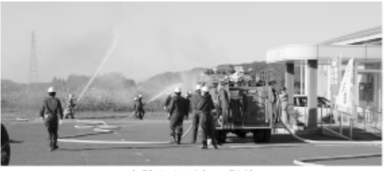
実践さながらの訓練