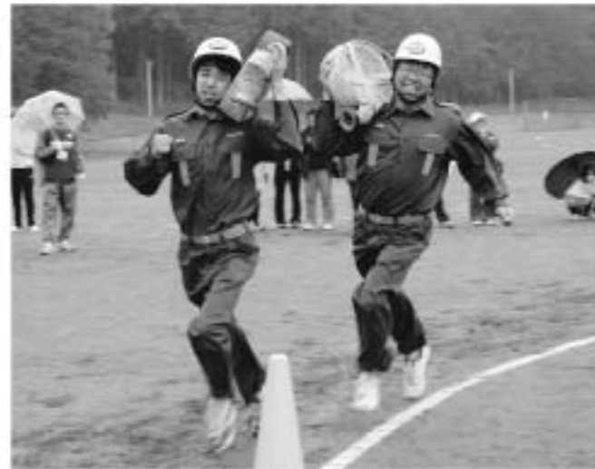
激走！消防団リレー