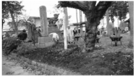
川原田ふれあいセンター (0.33μSv/h→0.15μSv/h)

表土除去等が行われ、実施前と比較すると実施後の放射線量は下記の通りとなりました。