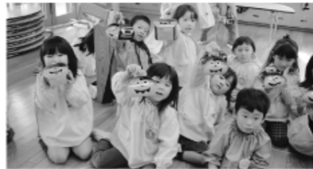
トリック オア トリート(幼稚園預かり保育)