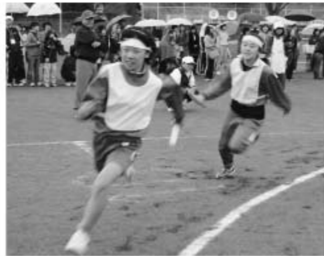
学区対抗選抜リレー