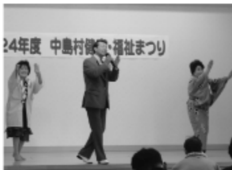
演歌歌手「泰楽五郎」の歌謡ショー