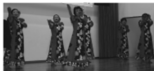
ハイビスカス・ドラムクラブ