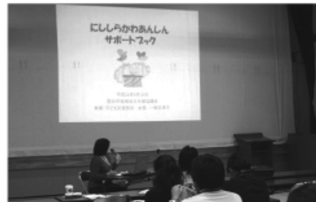
9月28日(金)矢吹町文化センター小ホールにて支援者向けの説明会がありました。