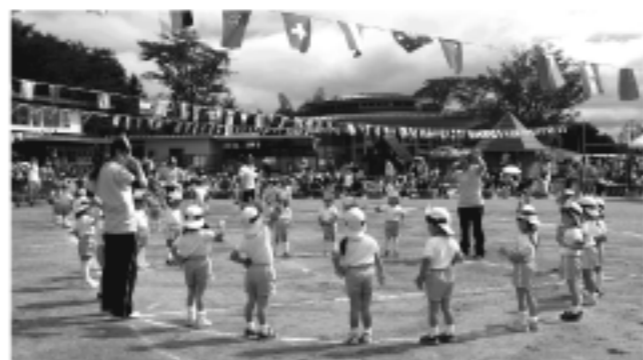
いっとうしょうたいそう(年少)

今年度は、2年振りの午後までの開催となり、青空の下で家族そろってお弁当に舌鼓を打ちながら、和やかに昼食をとる光景がたくさん見られました。