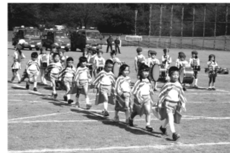
幼年消防クラブ鼓隊訓練