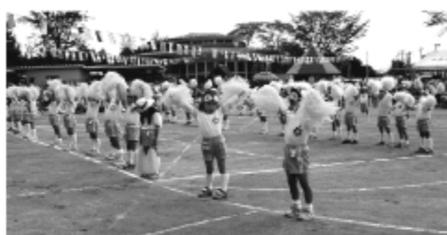
せんたくあらいぐま(年中)