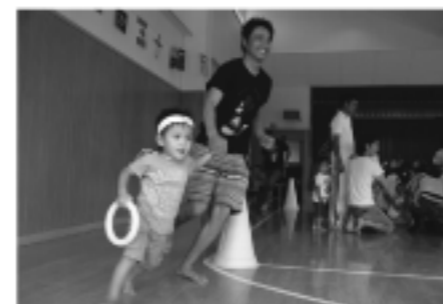
親子リレー(べんぎん親子)