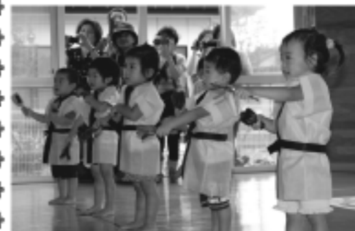
鳴子を手に法被で楽しくよさこい