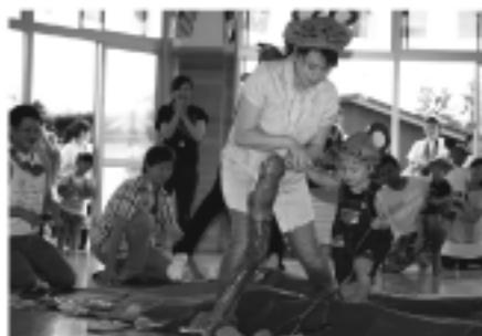
そこ握れ、チュウチュウ!(あひる親子)