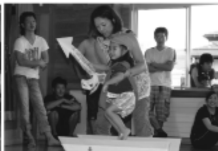
お魚とったど〜!!(すずめ親子)