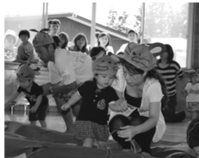
親子で協力して芋ほり