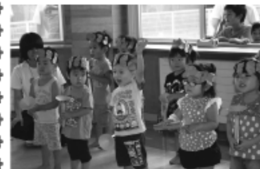
元気にお返事できました