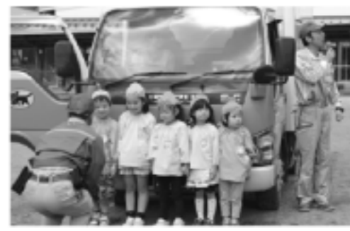
運転席からはトラックのすぐ前には園児は見えません