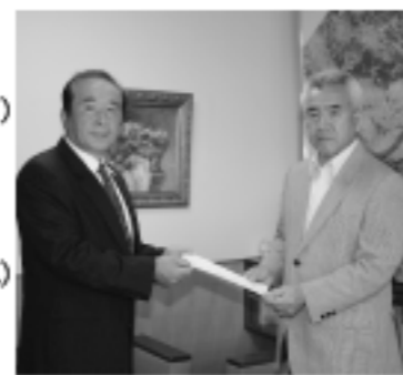
農業委員選任書を村長より交付