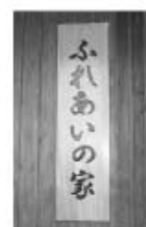
看板は工事施工業者からの寄贈で村長直筆

▼《宿泊》 ▼チェックイン 15時 ▼チェックアウト 10時 ▼使用者の範囲 高齢者ができる限り要介護状態とならないで自立した生活を営むことができるよう支援するとともに、その家族の疾病、冠婚葬祭、出張等により、又は身体的及び精神的負担の軽減等を図るため、一時的に居宅において日常生活を営むのに支障がある者を支援するもので、村内に居住するおおよね65歳以上の方で自立者又は軽度な補助で自立できる方。(補助者を含む) ▼1泊兼泊り料金(入浴料込) 一人 1600円