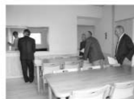
開所式終了後内覧