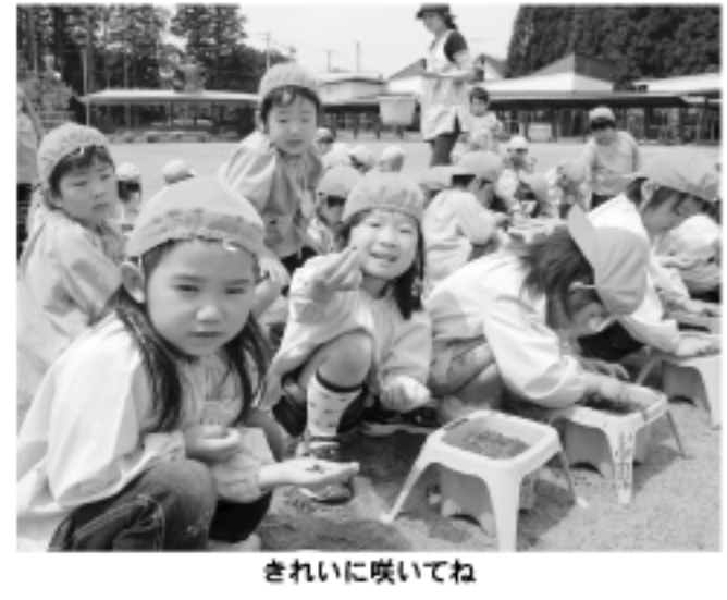
きれいに咲いてね