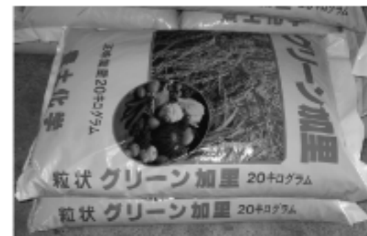
○配布された加里資材（カリ肥料）

国、県による放射性セシウムにかかる水稲栽培試験から、カリ含量の低い水田では、土壌の交換性カリ含量が25mg/100g程度となるように土壌改良した上で、地域慣行の施肥を行うと、玄米中の放射性セシウム濃度の低減に有効であることが明らかとなりました。したがって、放射性セシウムの吸収抑制対策のための土壌交換性カリ改良は、25mg/100g以上を目標とすると示されたところです。