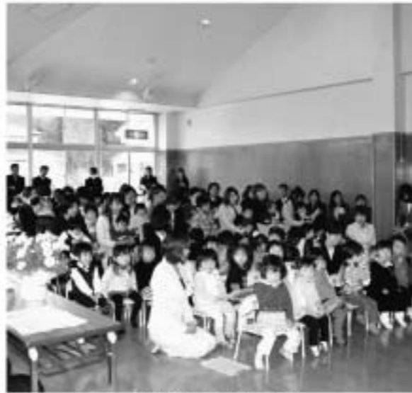
中島保育所の入所式