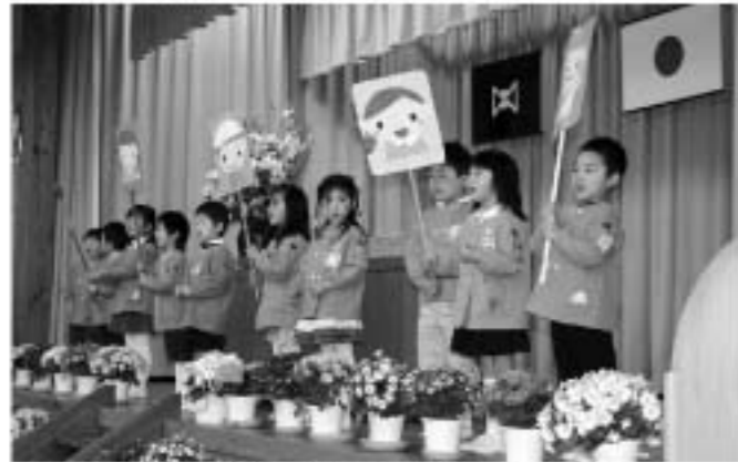
「困ったときは来てください。助けにいきます。」 歓迎の歌をうたう園児

新入園児呼名では、ひとりひとり名前を呼ばれると、大きな声で元気よく返事をしました。