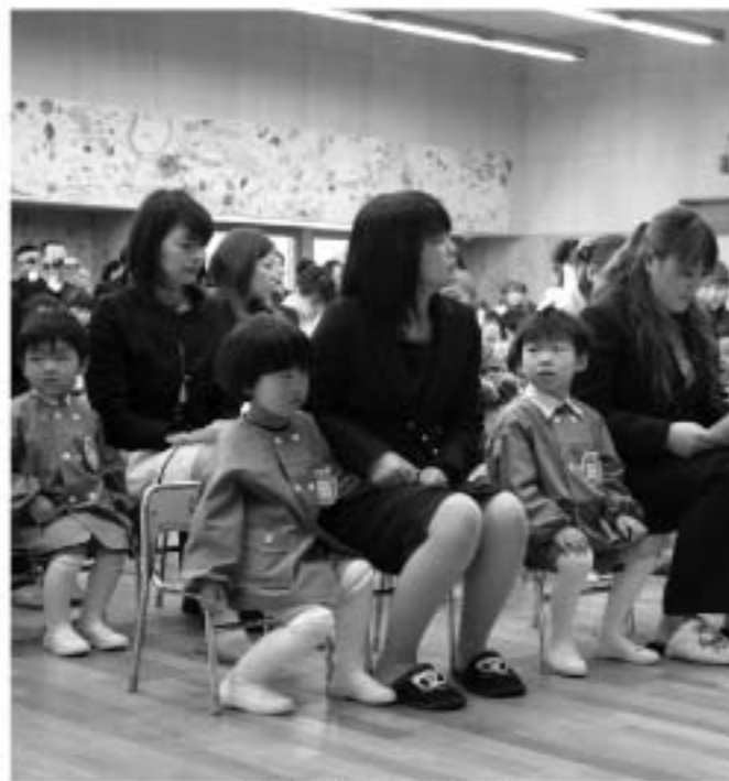
中島幼稚園の入園式