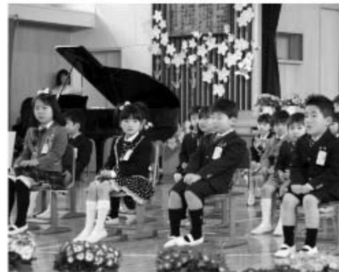
吉子川小学校入学式