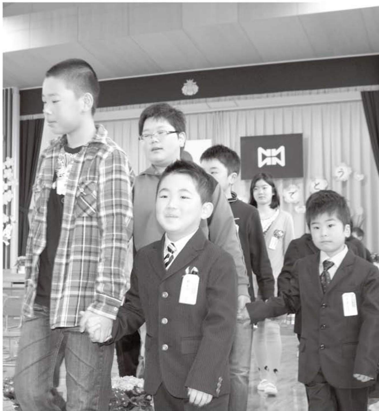
6年生のお兄さん、お姉さんとともに入場 吉子川小学校 入学式