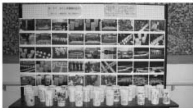
社会福祉協議会に飾られたキャンドル

県南では、白河市立図書館駐車場においてキャンドルナイト「ふくしま希望のあかり」が午後5時20分から開催され、村長と村内の親子約30名が参加しました。