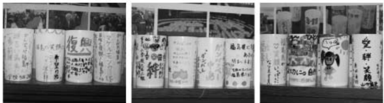
復興を願うキャンドルカバーに書かれたメッセージ