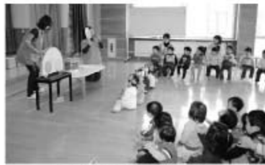
先生からの「だしもの」に夢中