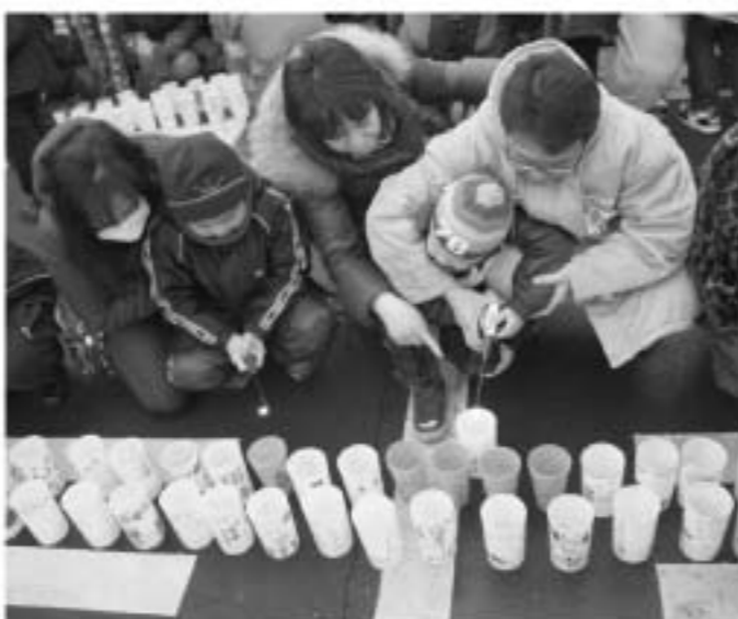
キャンドルにあかりを点灯