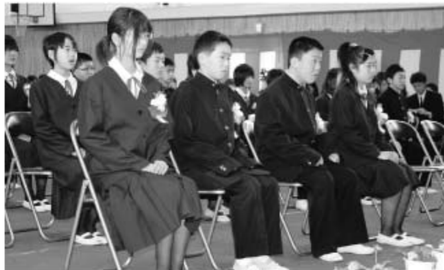
滑津小学校卒業式