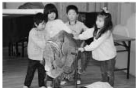
先生が制作した深海魚

先生が作成した「道案内をする蒼き深海魚」の前に、「白くどこまでも続く道」に見立てられた大きく長い紙が広げられ、「深海魚の散歩道」を描くのは園児達の想像力です。遊戯室の端から端まで斜めに大きく長い紙が広げられ、クレヨンを使って、のびのびと楽しんで絵を描きました。真教室が終わるころには、真