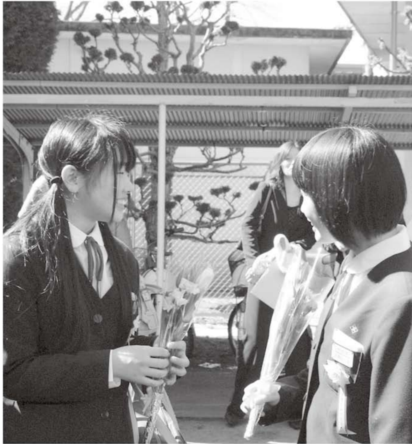
「離れてもつながっている」 笑顔で旅立ち (中学校卒業式)