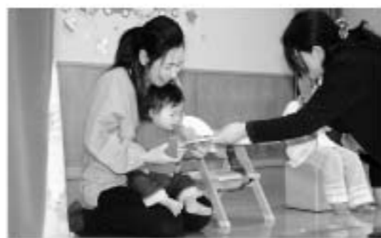
所長から本のプレゼント