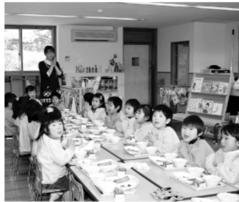
みんなで「いただきます」

現在、市場に流通している食料は、国、県が安全性の調査を実施し、それぞれ安全性が確認されて、流通経路にのっている給食食材を使用しており、安全であるとの前提のもとに学校給食が行われております。さらに食品の安全性について再確認するため、学校給食センターにおいて使用する食材に対して放射性物質の検査を実施しています。 ▼測定機器 Naイオンシミュレーションスペクトロメータ ▼測定場所 住民生活課・生活支援係 ▼検出項目 セシウム134・137 ▼測定時間 2000秒(33分) ▼検出限界 40ベクレル/kg ▼「検出せず(△○○)」の表示は検査結果の公表 学校により等で公表