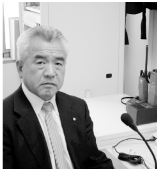
復興へ向けてのメッセージを放送する村長

世界が福島の復興を願っています。「福島はひとつ」です。前を向いて、手を取り合い、笑顔で前進して行きましょう。