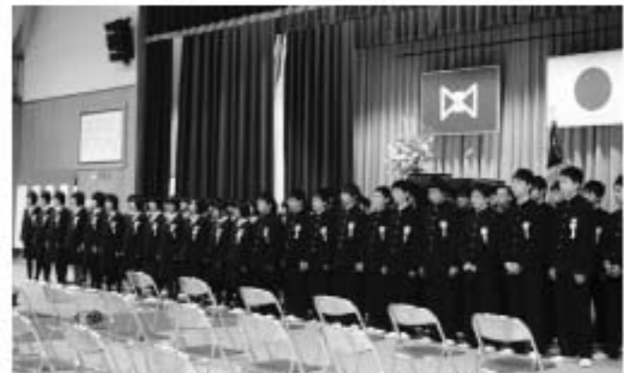
式歌「旅立ちの日に」を歌う卒業生