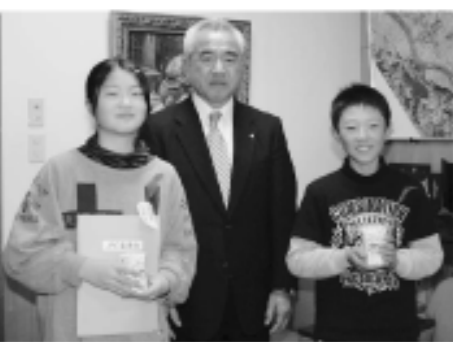
吉子川小学校JRC委員会より