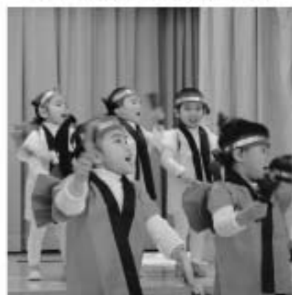
ヨサコイ(べんぎん)

一生懸命発表する我が子をカメラやビデオに収めながら、成長した子ども達の姿に、大きな拍手が送られました。