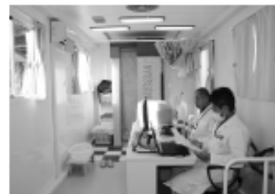
内部被ばく検査 ホールボディカウンターの中で2分間、静止して測定