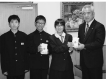
中学校生徒会より