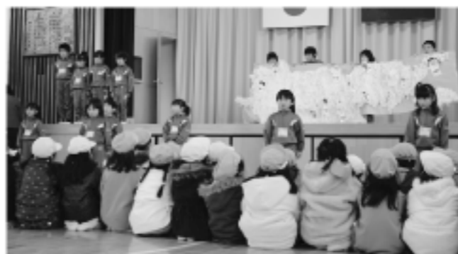
小学校の一日を劇で発表(吉子川小学校)