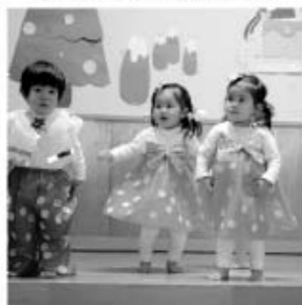
おそらのしたで(あひる)