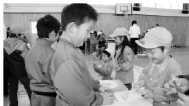
一緒に遊ぶ一年生と幼稚園年長児(滑津小学校)