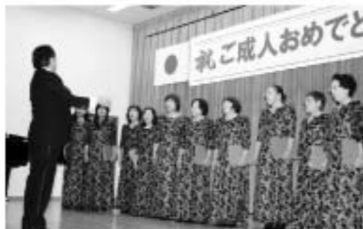
中島コーラス会から歌の贈り物