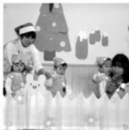
おさんぽひよこちゃん(ひよこ)