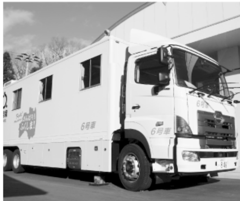
ホールボディカウンター車