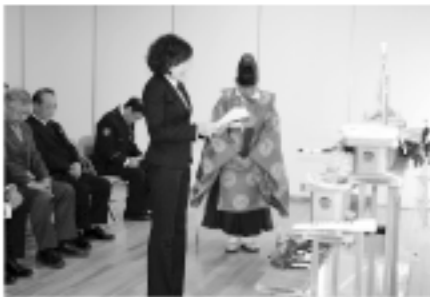
安全の誓いを読み上げる 村交通安全母の会会長