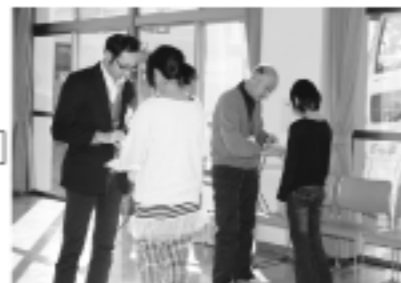
体の表面の検査 GMサーベイメータにより皮膚や衣類に放射性物質が付着していないことを確認