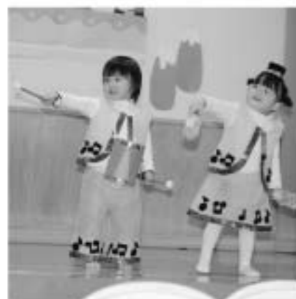
ゴロブジャカジャカ(すずめ)

その後、保護者が遊戯室で幼稚園生活や入園前の準備などの説明を受けている間、子ども達は先生と保育室で保育活動を体験しました。初めは保護者と離れて不安な様子だった子ども達も、幼稚園生活の雰囲気慣れ、帰りには在園児が作ってくれたプレゼントをもらって帰りました。