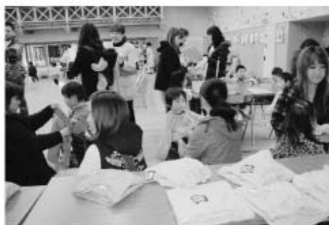
スモックや制服などを試着