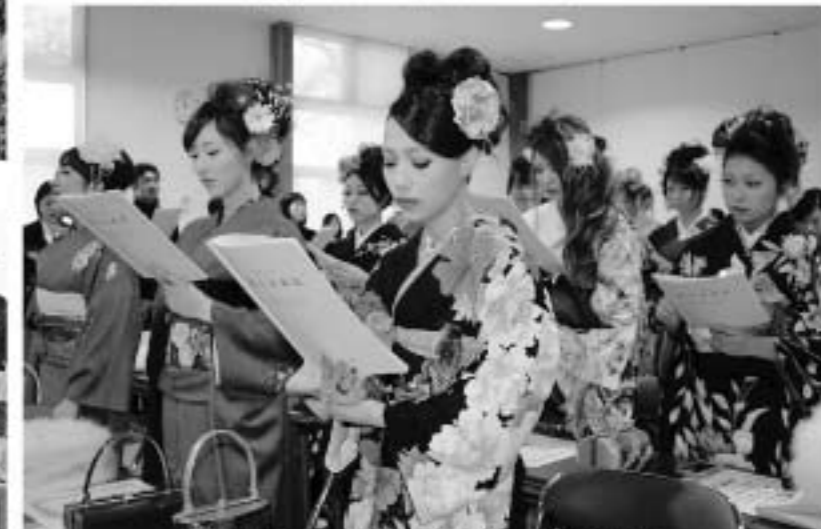
全員で「ふるさと」・「中島中学校校歌」を合唱