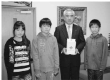
滑津小学校企画委員会より