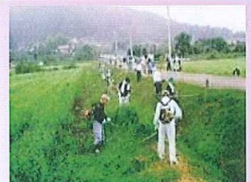
農地法面の草刈り