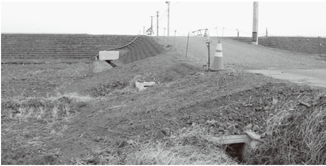
通学路の安全対策が求められる県道バイパス交差点付近

平成二十四年度に一部供用開始が予定され、交差点も数か所設置される見込みである。児童生徒の通学路にもなっているため、県公安委員会等へ信号機の設置を要望している。また、児童生徒の通学時の安全対策の面から、「歩道のたまり場」等の設置についても併せて要望している。今後とも児童生徒の通学時の安全・安心の確保に向けて対策を講じて参りたい。次にバイパス下の排水対策については、大断面のボックス