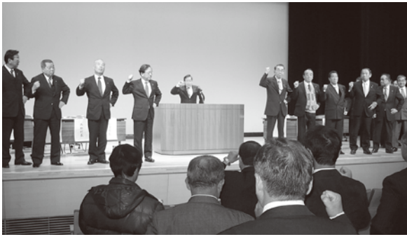
原発事故賠償指針の見直しを求める決起集会