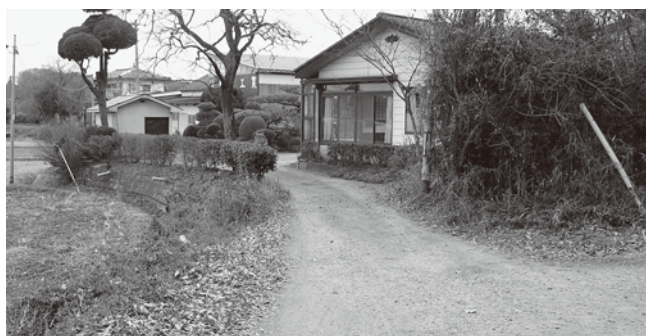
狹隘道路整備事業として調査 (川原田地区)