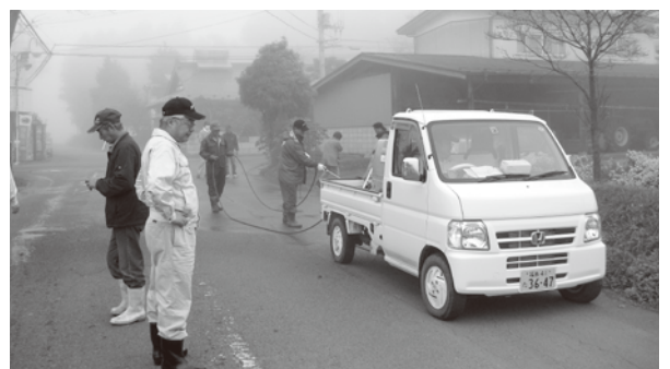
村内一斉除染作業

放射線除染作業において、道路わきの土砂を取らないで高圧洗浄機で洗浄することは土砂をかきまわしたに過ぎない、今後できるだけ早く汚染土壌の撤去をお願いしたい。