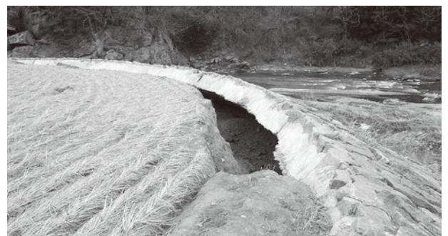
台風15号による被災水田（阿武隈川左岸鷹ノ岡地内）

大池、横池については、国の査定を経て年内発注に努めたい。改善センターについては、新耐震基準適用以前の建物であることから、まず耐震診断を受けたところである。その結果、災害復旧工事と併せて耐震補強工事を実施すれば使用可能との報告を受けている。そこでまず災害復旧工事を優先させ、耐震補強についてはその後対処したい。