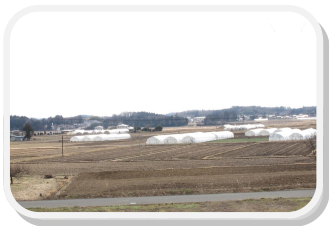
分譲地から見た高台の風景