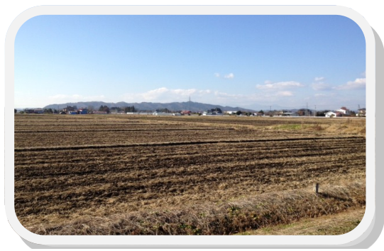
田園より鳥峠を望む