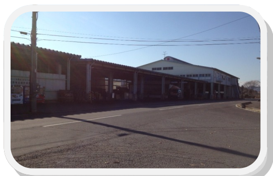
J A しらかわ中島野菜集出荷場