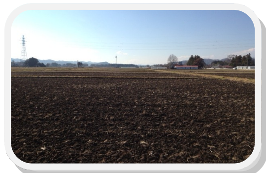
田園より那須連峰を望む