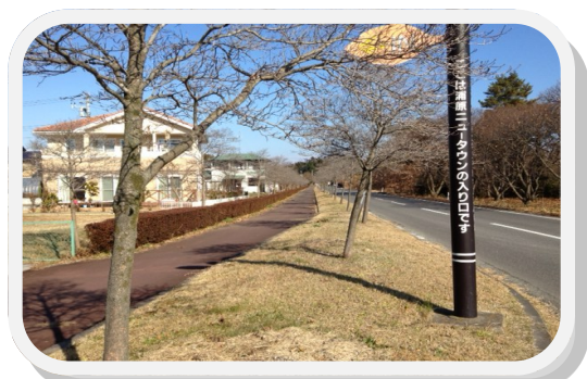
浦原ニュータウン花水木並木道