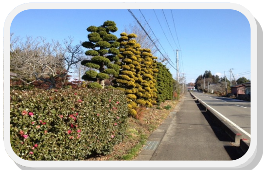
きれいに整備された生垣風景