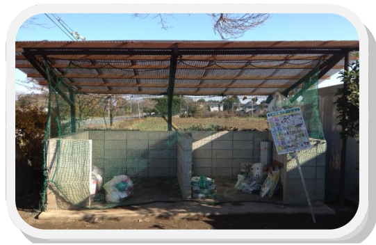
環境美化〔ゴミ集積所清掃事業〕