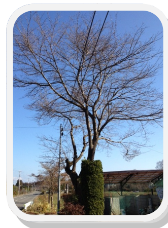
大雷神社〔浦原さくら祭り〕（仮称）