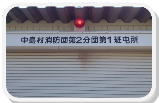
地域防災訓練〔浦原消防団〕