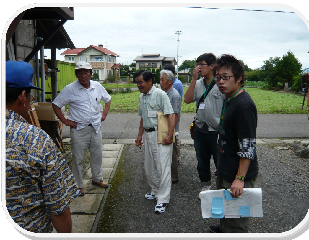
平成二四年度に実施された集落点検ワークショップの様子。