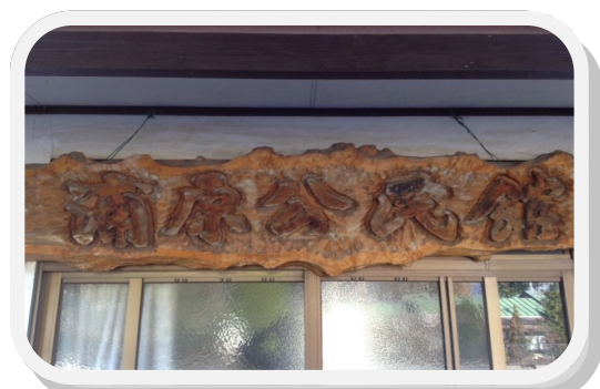
ふれあいステーション〔浦原公民館〕