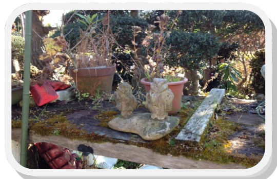
美術・芸術の祭典