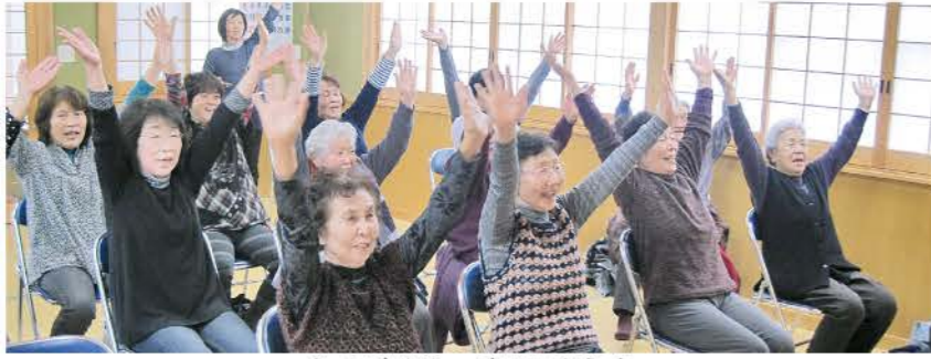
ミニデイサービスのようす

高齢者肺炎球菌の予防接種の対象となる方には、平成27年4月に役場保健福祉課から接種券が送られています。まだ受けられていない方は早めに受けるようにしましょう。