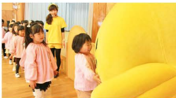
また幼稚園に来てね!