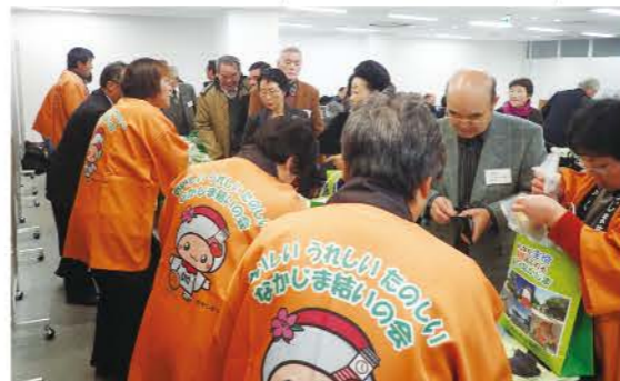
大にぎわいの直売