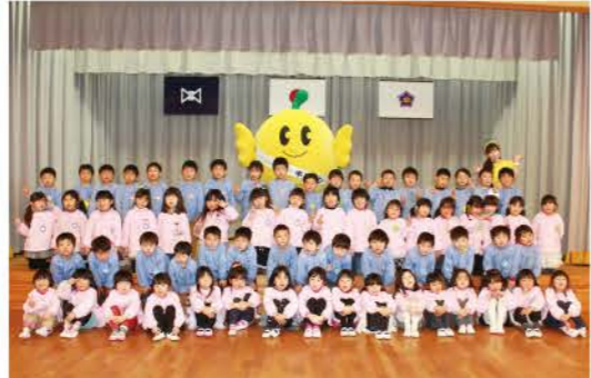
キビタンと記念撮影

1月26日(火)と1月29日(金)中島幼稚園に福島県のシンボルキャラクター「キビタン」が訪れました。