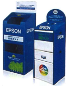
エプソン：インクカートリッジ回収ポスト

各メーカーにおいて製品販売店の店頭「回収ポスト」「回収スタンド」を設置しています。