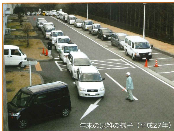
年末の混雑の様子（平成27年）