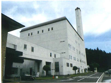
西白河地方クリーンセンター