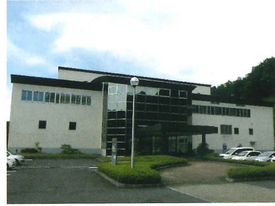
西白河地方リサイクルプラザ