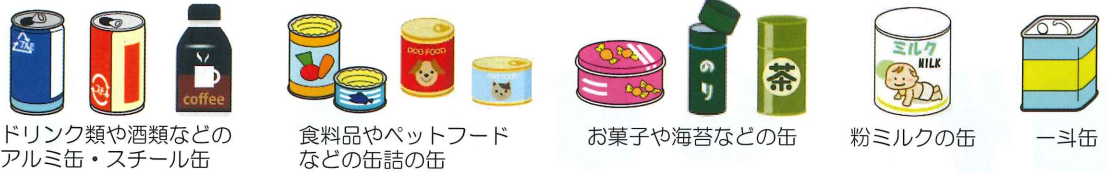
ドリンク類や酒類などのアルミ缶・スチール缶