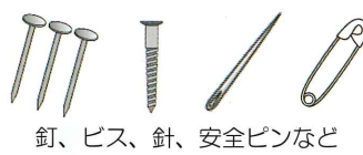
釘、ビス、針、安全ピンなど