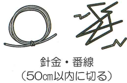
針金・番線 (50cm以内に切る)