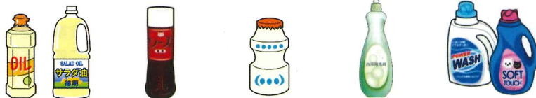
食用油などの容器 ソースなどの調味料の容器 乳酸菌飲料の容器 台所用洗剤 洗濯用洗剤・柔軟剤の容器

左記のものは、いずれも汚れが落とせれば「プラスチック製容器包装」として出せます。