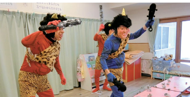
幼稚園にも鬼がやってきた!