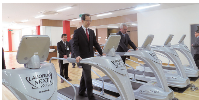
トレーニング器具を体験する内堀福島県知事