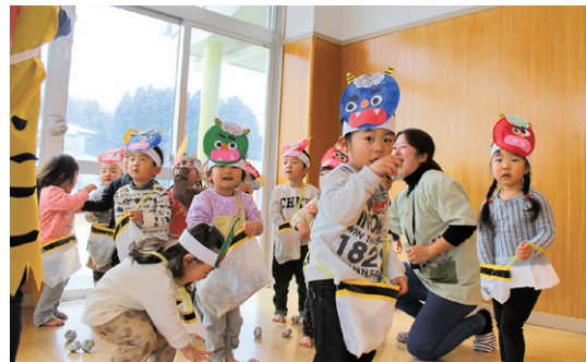
かわいいお面をつけて鬼退治!(保育所)

2月3日の節分に合わせ、村内の幼稚園・保育所では2月2日(金)に豆まきが行われました。