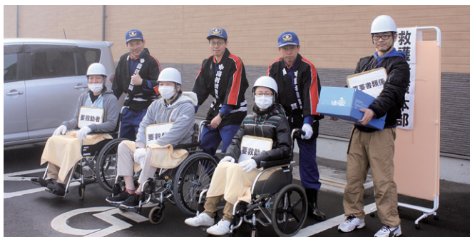
利用者の救護を想定した避難訓練