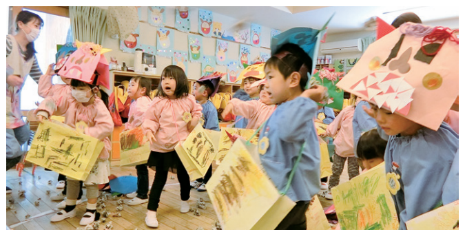
「鬼は外!」みんなの元気で鬼退治