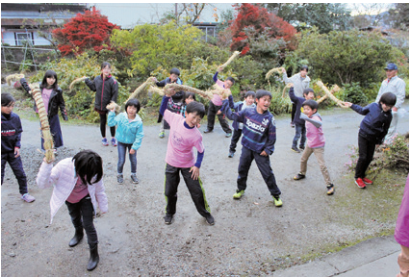
「むじなぶち」の様子

このほか、多面的機能支払交付金による活動は各集落の組織で積極的に行われています。村では、今後も意欲的な組織の活動を支援していきます。