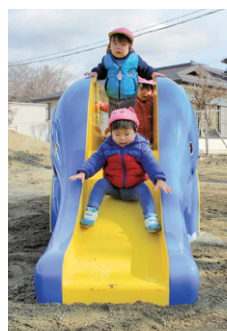
新しいすべり台に夢中!