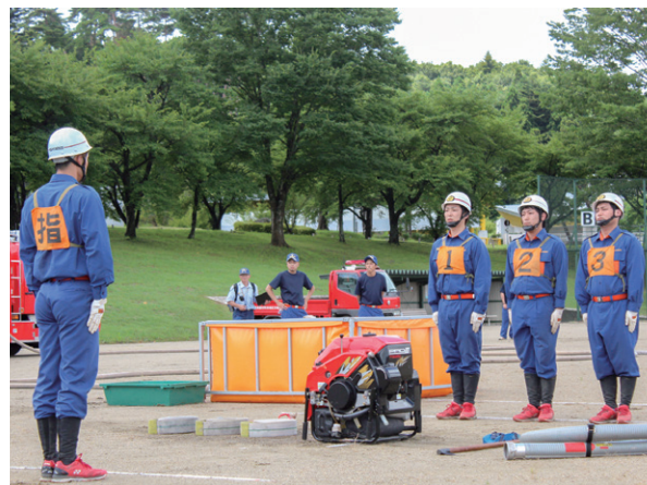
訓練の成果を発揮