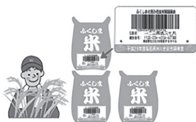
1. 玄米袋を検査場に持ち込みます (生産者識別用のバーコードラベル付)