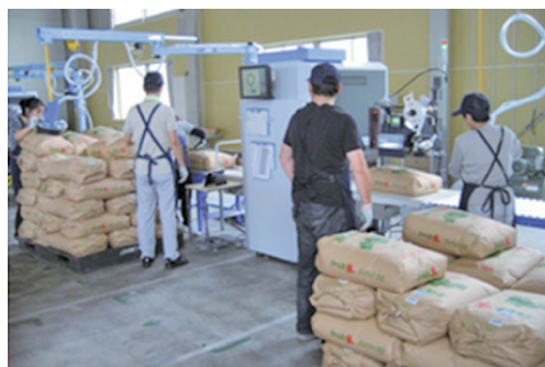
米の全量全袋検査の様子