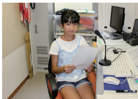
「車に気を付けて帰りましょう。」