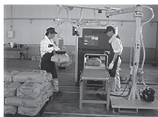
2. 袋をベルトコンベアに載せてバーコード を読み取り、検査器で測定