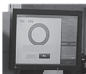
3. 結果がスクリーニング レベル以下であれば合格