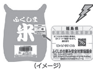
4. 玄米袋に検査済ラベルを貼り 付け出荷されます (イメージ)