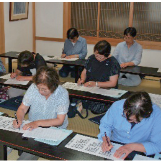
真剣に写経に取り組む学級生

最後にご住職手作りの精進料理「いちじくカレー」をご馳走になり、心も体もリフレッシュできた坐禅と写経の会でした。