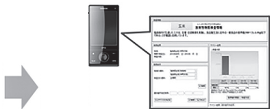
5. 結果はウェブで確認 https://fukumegu.org/ok/kome/