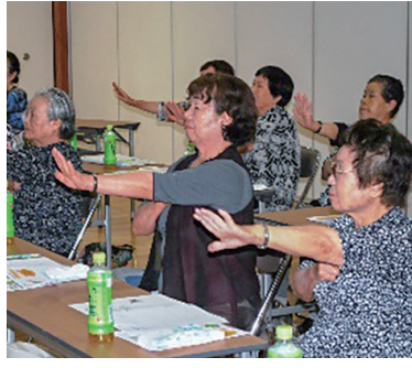
楽しくてためになるお話に釘付け

7月11日(水)にクラウン大学第4回講座「健康教室Ⅱ 運動の大切さ」を輝ら里アリーナ1で行いました。