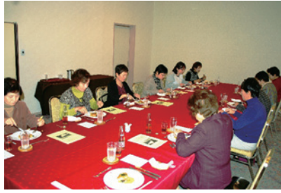
落ち着いた雰囲気の中で

11月14日(水)に第7回講座「テーブルマナー教室」が「ホテル ニュー日活」で行われました。