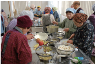
協力しながら新しい料理に挑戦

24名の参加者は、慣れた手つきで調理に取り掛かり、予定よりも短時間で完成させました。寒くなるこれからの時期、心も身体も温まる料理ができ上がり、全員でとてもおいしくいただきました。