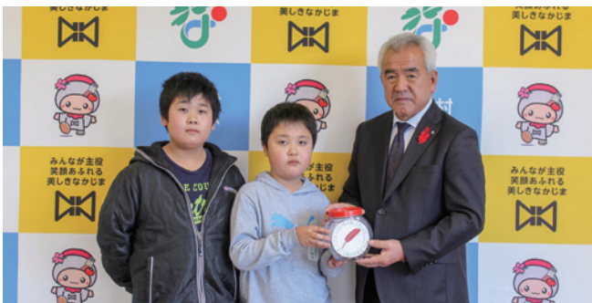
吉子川小学校JRC委員会