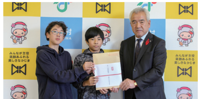
滑津小学校企画委員会