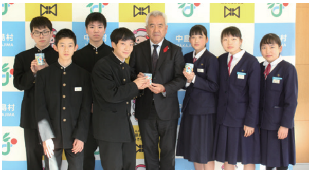
中島中学校生徒会

村民の皆さんからいただいた貴重な募金は、地域福祉のために活用させていただきます。ご協力ありがとうございました。