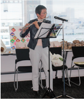
フルートの曲当てクイズ