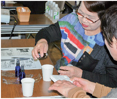
アロマの効能を確かめて

最後に、自分で選んだアロマスプレーを作って学習を終えました。アロマのイメージが変わる学習でした。