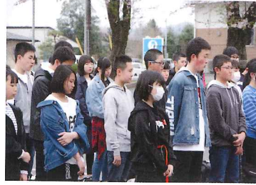
マレーシアへ行ってきます！