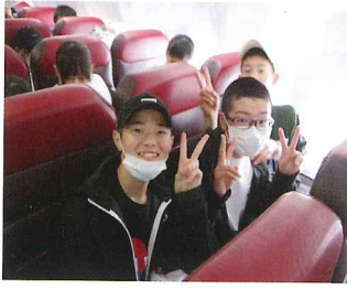
飛行機に乗って出発！

成田空港から出国。コタキ ナバル到着後は、現地のショ ッピングセンターで買い物 しました。