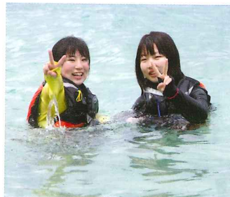
すごくキレイな海だよ！