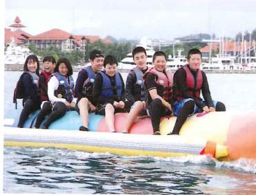
バナナボート出発！