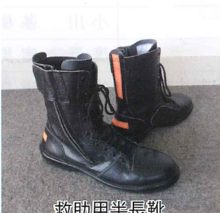
救助用半長靴 (従来の長靴より耐久性・耐熱性に優れる)

平成30年度及び今年度の事業で消防団員の安全性向上のために救助用半長靴を購入し、検閲当日に団員はこれを履いて参加しました。この半長靴は火災などの災害時にも活用されます。