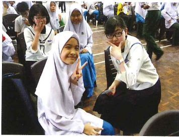
仲良くなりました♡

午後はサバ大学に行き、現 地の大学生とオリエンテーリ ングをしました。暑い中での 活動でしたが、生徒たちは大 学生との交流をとっても楽しん でいました。