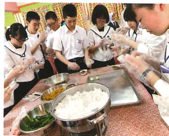
現地のおやつ「オンデオンデ」