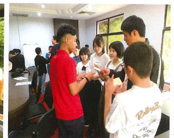
英語で自己紹介できるかな？

午後はサバ大学に行き、現 地の大学生とオリエンテーリ ングをしました。暑い中での 活動でしたが、生徒たちは大 学生との交流をとっても楽しん でいました。