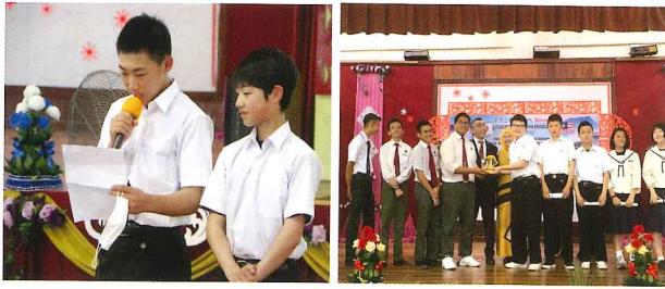
中島中の日常を英語で紹介