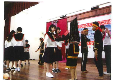
踊りを教えてもらいました

交流会では、踊り、楽器、 料理の3つのグループに分か れて活動し、現地の文化に触 れることができました。