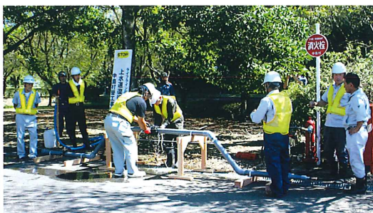
村管工事協会による水道管漏水復旧訓練