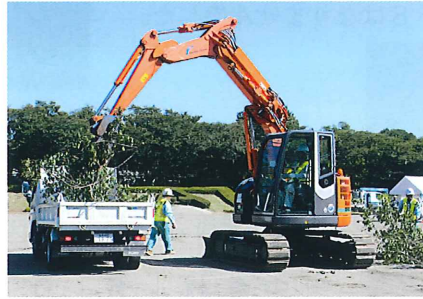
(株)小平建設工業・(株)長田建設による倒木除去訓練