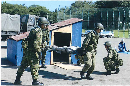
村消防団員・自衛隊員による倒壊建物からの救助訓練