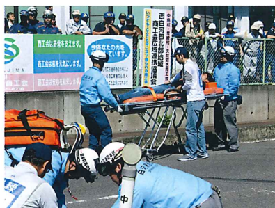
行政区参加者、消防署員、警察署員による負傷者搬送、トリアージ訓練