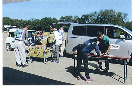
セブンイレブン中島店・行政区参加者による支援物資受入訓練