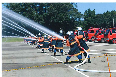
村消防団員による一斉放水訓練