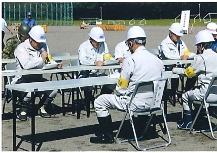
村職員による災害対策本部設置訓練

村消防団員をはじめ、村関係機関、行政区参加者、消防署、警察署、自衛隊など総勢700人が参加し、災害時の迅速な対応について確認するとともに、防災への意識を高めました。