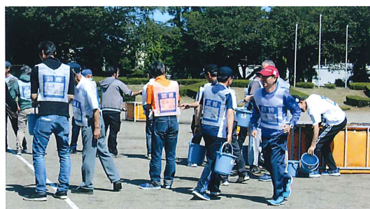
区参加者による消火訓練（バケツリレー）