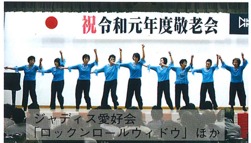
ジャデイス愛好会「ロックンロールウイドウ」ほか