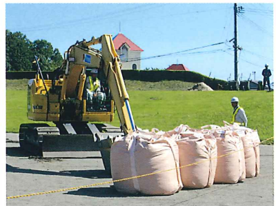
(株)宮崎工務所による大型土のう積み訓練