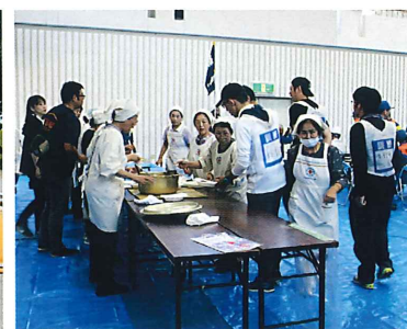
赤十字奉仕団による炊き出し訓練