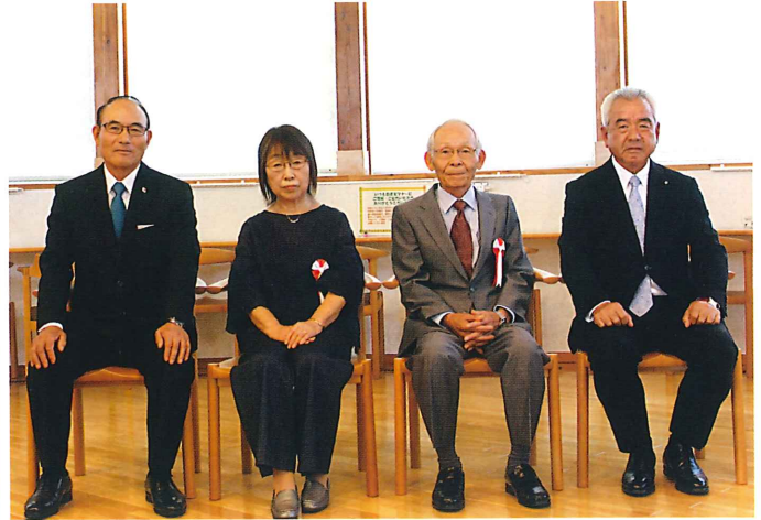
しあわせ金婚表彰ご夫妻