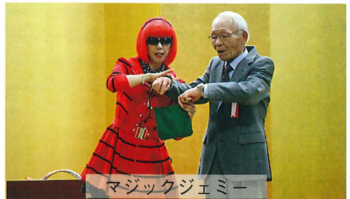
マジックジェミー