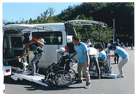
社会福祉協議会、ひかりの里による避難行動要援護者受入訓練