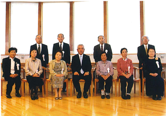
ダイヤモンド婚表彰ご夫妻