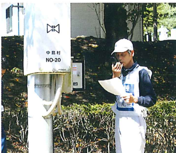
滑津原防災会による防災無線の放送訓練