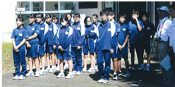
中島中学校生徒による体育センターからの避難訓練