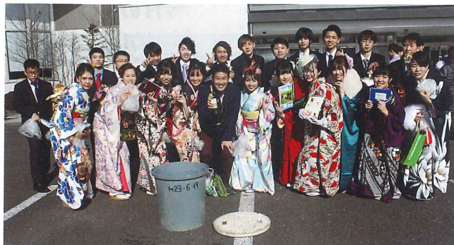
滑津小思い出のタイムカプセル 成人式にオープン!!