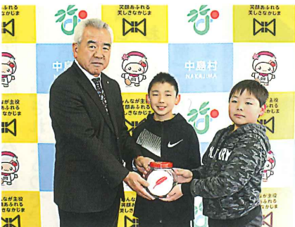
吉子川小学校JRC委員会