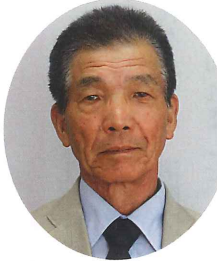
圓谷 哲 (中島、ニツ山、ニツ山住宅) 中島グリーンタウン