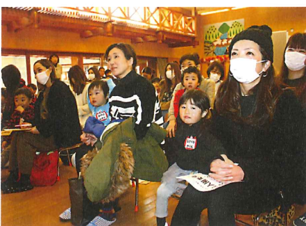
楽しそうな入園予定児のお友達と保護者の皆様