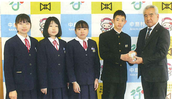
中島中学校生徒会

園児・児童・生徒の皆様からいただいた貴重な募金は、地域福祉のために活用させていただきます。ご協力ありがとうございました。