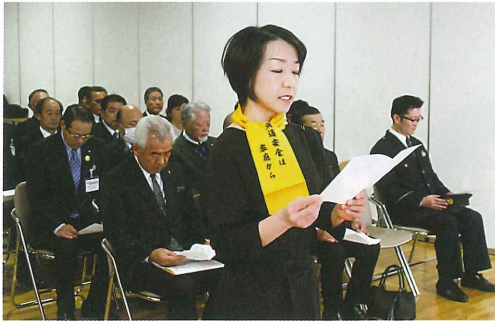
ウォード嘉代村交通安全母の会会長

また、ウォード嘉代村交通安全母の会会長が、三つの「安全の近い」を読み上げ、安全安心な地域社会の実現のため、全力を尽くすと誓いました。