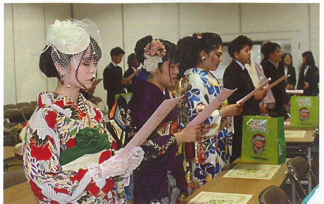
コーラス会の皆さんと中島中学校の校歌を歌う新成人の皆さん