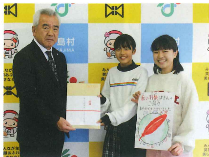
滑津小学校企画委員会