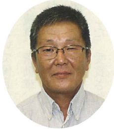
高村喜則 (原中、原下、平名塚、下平名塚、東平名塚) 西平名塚、中島第4ニュータウン