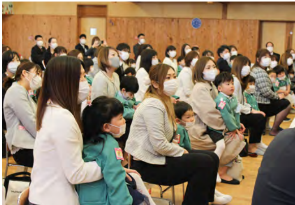
しっかり園長先生のお話を聞いていました