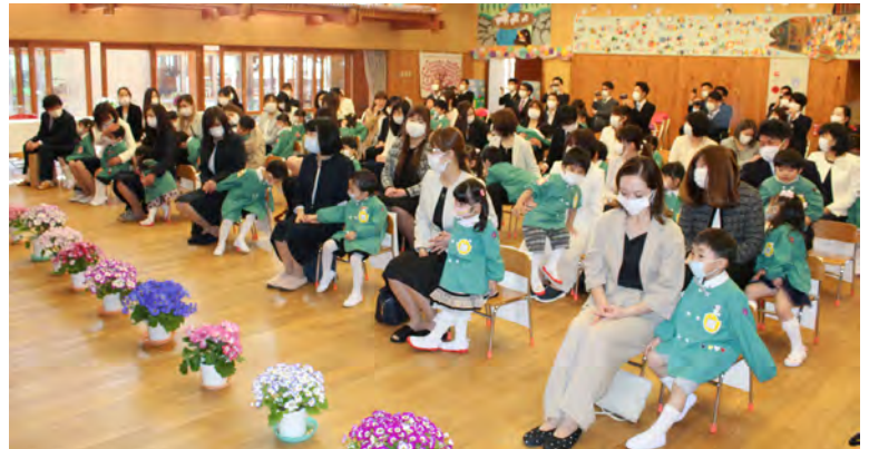
新入園児と保護者のみなさん