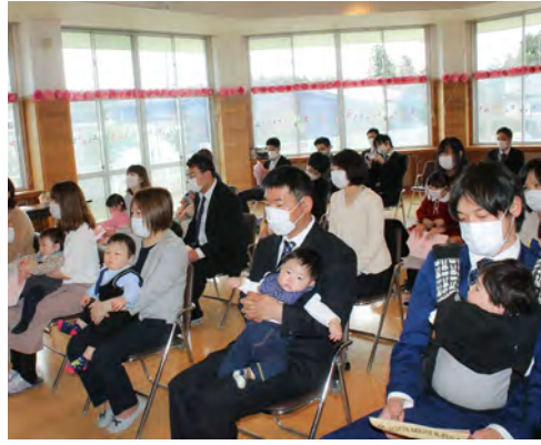
新入所児と保護者のみなさん

はじめての先生やお友だちと過ごす保育所で、どんどん成長していくみなさんの姿が楽しみです。