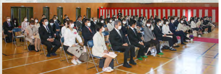
晴れの日を見守る保護者のみなさん