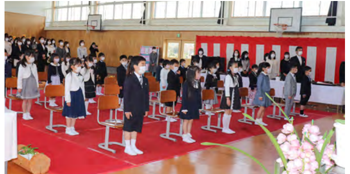
かっこよく「一同礼！」