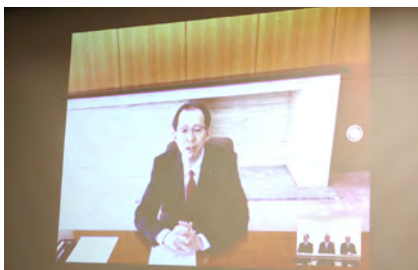
内堀知事とテレビ会議の様子

その他、新型コロナウイルス感染症以外にも通常のトピックスによる意見交換も行われ、村政発展に繋がる貴重な会議となりました。