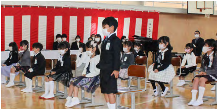
元気な声で返事ができました