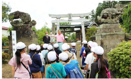
小平さんの説明を熱心に聞く児童のみなさん

6月25日(木) 吉子川小学校3年生19名が社会科の授業の一環として、村指定文化財に指定されている川田神社の「狛犬」について学習しました。