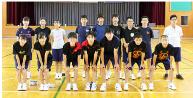
特設駅伝部のみなさん

中体連駅伝県南大会は9月2日に、ふくしま駅伝は11月15日に開催を予定しています。