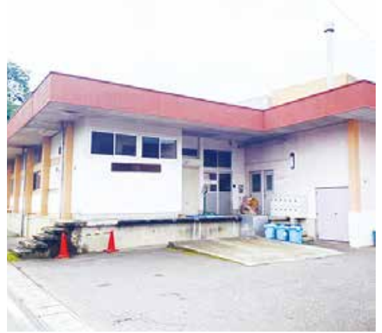
老朽化した現中島村学校給食センター (昭和43年築)