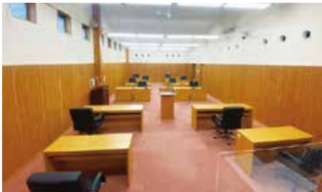
3密を避けた議場（議員控室も利用）

国の「被災児童生徒就学支援等事業交付金」の継続と児童生徒の十分な就学支援を求める意見書 原案のとおり可決し関係機関へ送付した。