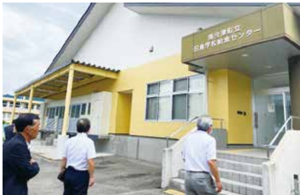
→ 田島学校給食センターを視察