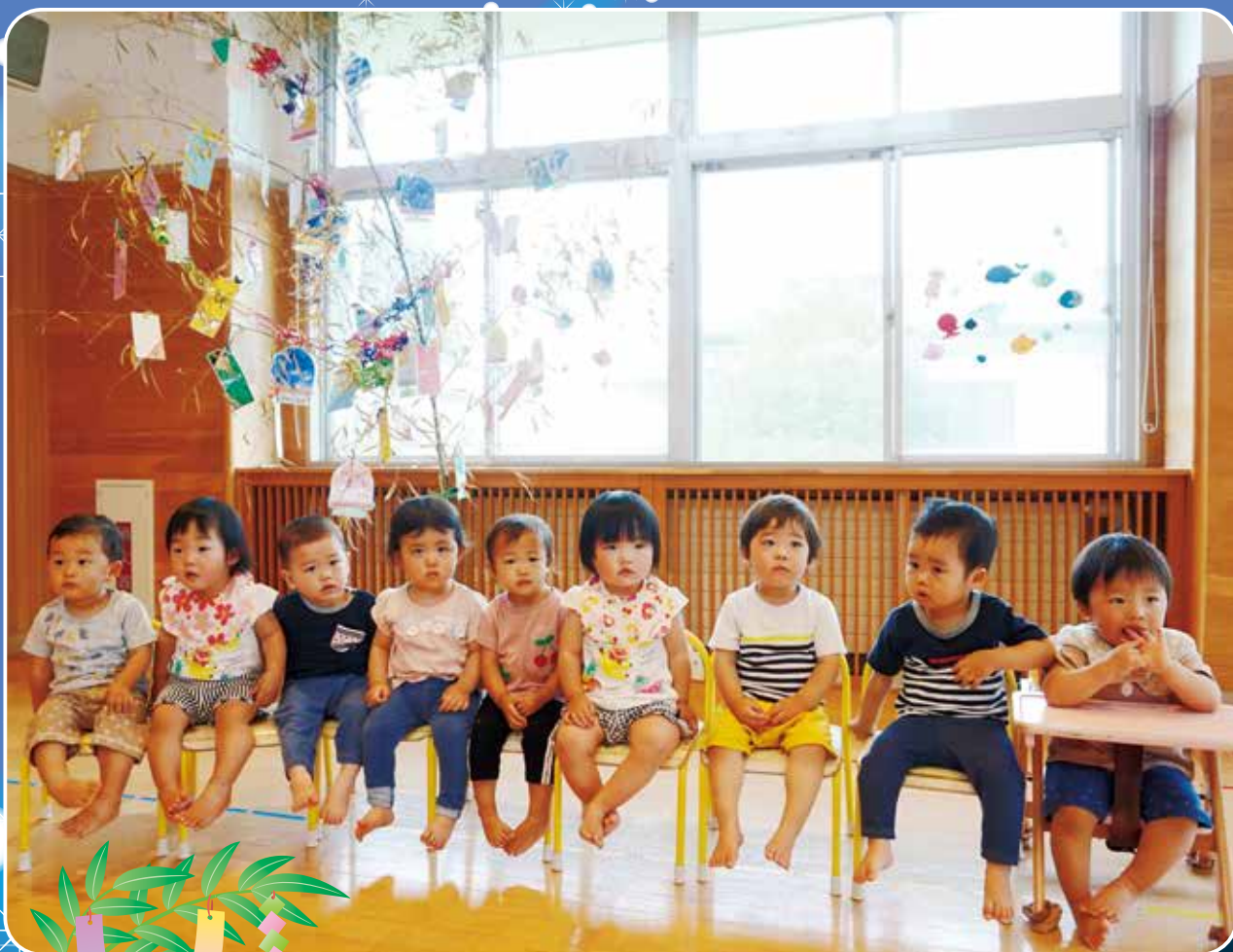
<中島保育所 七夕会 7/7>