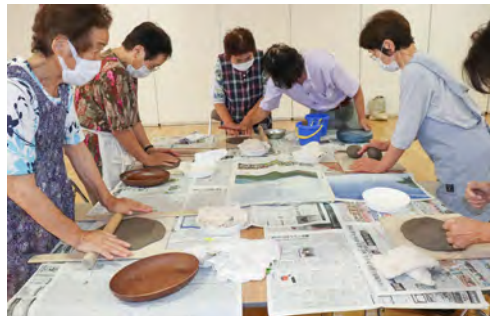
先生の指導で作りたい形に近づけます

クラウン大学第2回講座の陶芸教室が、8月27日(木)生涯学習センター輝ら里で行われました。