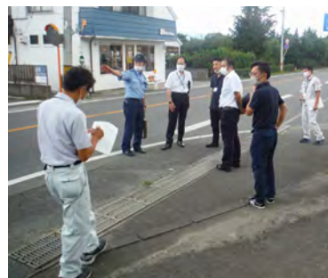
通学路点検の様子

主な箇所として滑津小学校の通学路では、小学校前の県道泉崎石川線、整備工事が完了した村道御蔵場本法寺裏線が挙げられました。吉子川小学校の通学路では、園芸流通センター前交差点、川原田パイパスが挙げられました。