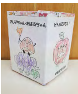
2歳児27名がつくりました

例年、歌やダンスを披露し利用者の方々と触れ合う場が設けられていましたが、今年度は、新型コロナウイルス感染症防止を考え、代表3名のお友だちがプレゼントを届けました。