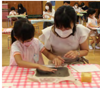
上手にお花の形ができました✿

8月28日(金) 幼稚園で年長親子陶芸教室が開かれました。この教室は、一緒にものを作る楽しさや親子の絆を深めながら、幼稚園時代の思い出になる作品を作ることを目的に開催しています。今年度は新型コロナウイルス感染症予防のため、例年より時間を短縮し、クラスの入れ替えをしながら実施しまし