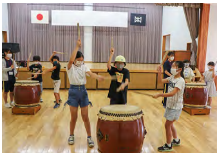
発表に向け一生懸命練習しています

練習は紙ばちでたたく練習から始まり、毎週練習を積み重ね、10月3日(土)には保護者へ向けて練習の成果を発表します。