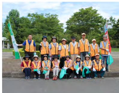
ご協力いただいたみなさん

9月8日(火) 白河たばこ販売協同組合16名のみなさんが、童里夢公園周辺の清掃活動を行いました。