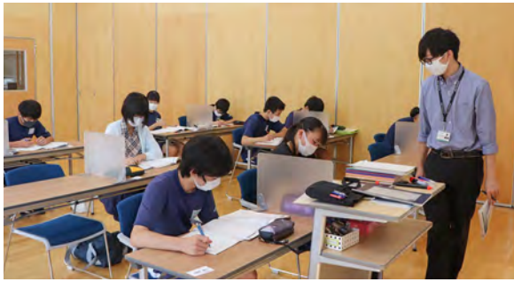
学習に集中する生徒のみなさん

8月8日(土)よりベスト学院から2名の講師をお招きし、基礎と応用コースに分かれ毎週土曜日午前中学習会に取り組んでいます。 また、希望者は新教研もぎテストにも取り組み、希望進路実現に向け頑張っています。