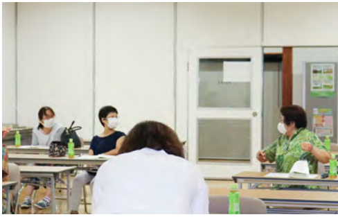
一年間の活動について話し合いました

コロナ禍の影響で全てが例年通りとはいきませんが、今年も楽しい教室になりそうです。