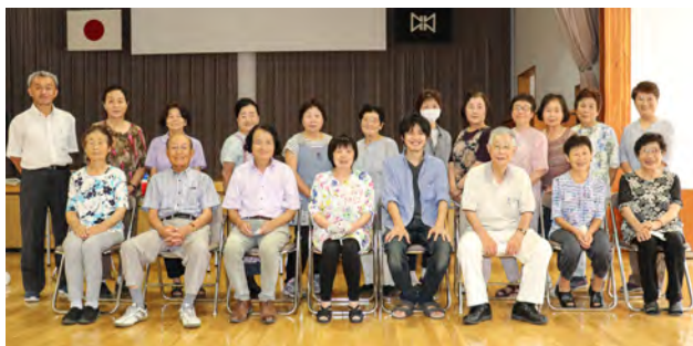
すっかり顔なじみの先生(前列中央3名)と記念撮影

に出品するのですが、今年は新型コロナウイルス感染症の影響で、村民文化祭が中止となりました。残念ながら皆さんに見ていただくことはできないのですが、素敵な陶器がそれぞれの家庭で美しさを放っているところを想像すると焼き上がりがとても楽しみです。