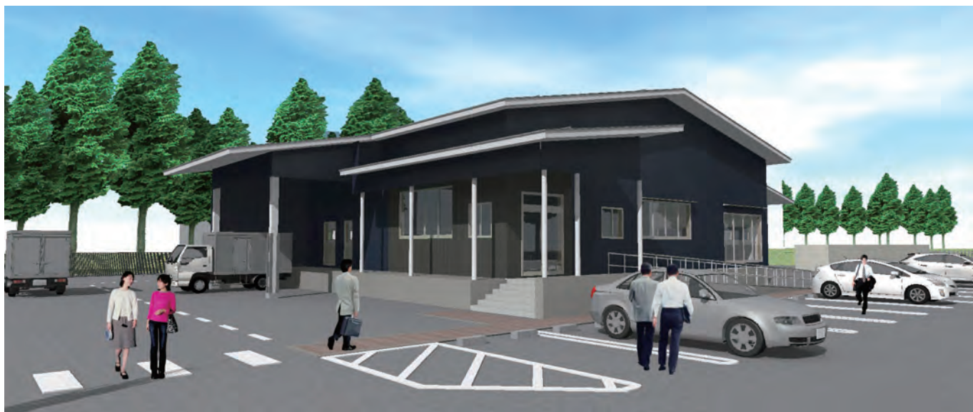
〈新築給食センター予想図〉