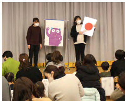
押してはいけないボタンに夢中！

遊戯室に集まった子どもたちへ、絵本「ぜったいにおしちやダメ？」のストーリーを用いた出し物を先生方が披露しました。子どもたち全員参加型の内容で、子どもたちの元氣な笑い声が遊戯室に響き渡りました。