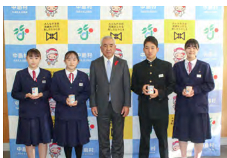
中島中学校生徒会