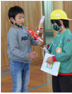
手づくりロケットに興味津々

12月11日(金)は吉子川小学校を訪問し、校舎内を見学した後、1年生が歌や鍵盤ハーモニカ演奏を披露しました。