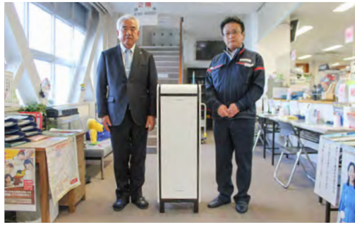
寄贈されたスタイリッシュなデザインの空気清浄機

いただいた義援金は、新型コロナウイルス感染症対策事業に活用させていただきます。空気清浄機は、住民生活課窓口を設置しました。