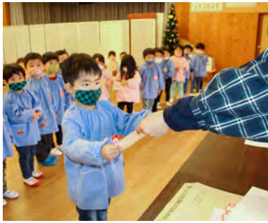
3歳児代表園児へ表彰状