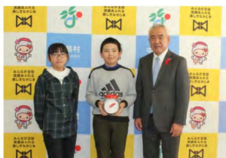
吉子川小学校JRC委員会