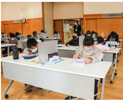
集中して課題に取り組む参加児童

参加した子どもたちは集中して課題に取り組み、学習が進んだという声も多く聞かれました。あつという間の2日間でした。