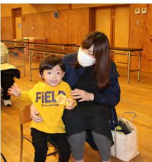
上手に返事ができました