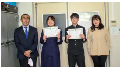
中学3年生代表の生徒2名へ