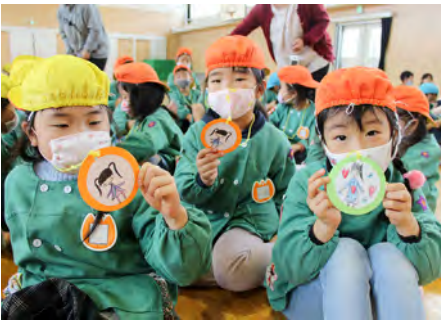
手づくりメダルのプレゼント