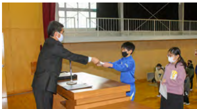
吉子川小学校 ～代表児童へ表彰伝達～