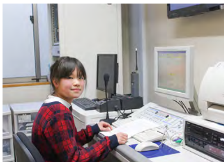
落ち着いて丁寧に原稿が読めました!