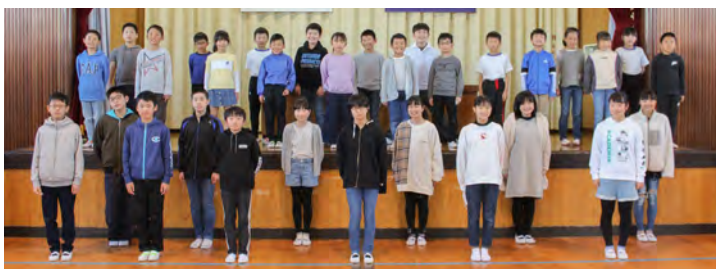
滑津小学校 ～3年生・6年生の皆さん～