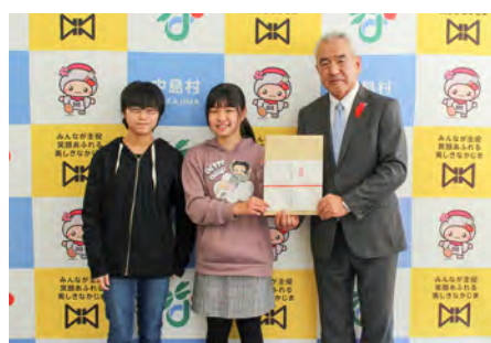
滑津小学校企画委員会