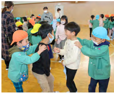
じゃんけん列車で大盛り上がり