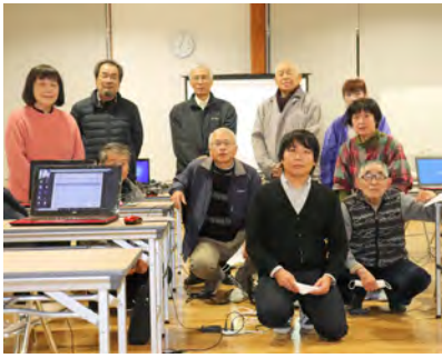
5日間の講習でスキルアップ！

今回は、年賀状作成ソフトをダウンロードし、スマホから画像を取込み作成したり、ズームソフトを使用したオンライン会話やスクラッチを使ったプログラミングを体験し、「楽しかった。ぜひまた受講したい」など大変好評でした。