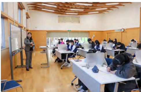
分かりやすい解説で難問クリア！

今年度は、例年よりも多くの参加希望があり、児童館と輝ら里の2か所での実施となりました。また、高校生4名が学習ボランティアとして参加し、生徒達の学習を支援しました。