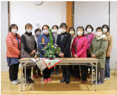
先生と作品を囲んで記念撮影