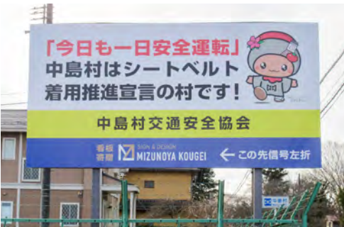
安全運転で事故ゼロへ！

交通安全推進のため、早めのライト点灯、ゆとりある運転を心がけ、交通事故をなくしましょう。