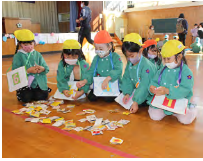
牛乳パックの「ぴよんがえる」

手づくりロケットやヨットカー、魚つりゲームなどが準備され、園児の皆さんは、お祭り感覚で各ブースの催しを楽しみました。