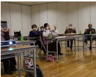
笑顔で体操に取り組む生徒のみなさん