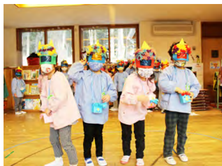
年中組さん、鬼のお面がカッコいいね 😊