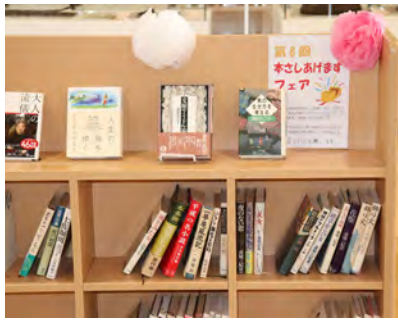
たくさんの本の寄贈ありがとうございました！

村民の皆様からは、「返却日を気にせず、ゆっくり読むことができる」「毎年ありがたいです」と喜びの声がかげられました。また、中には、喜んで沢山いただいている方もいらっしゃいました。