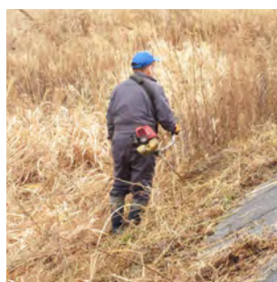
のり面の雑草を刈り取る参加者

1月17日(日) 川原田地区住民の皆さんが、常陸橋下流の阿武隈川堤防のり面の草刈りを実施しました。