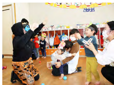
「鬼は〜外」笑顔で豆まき! 鬼も降参!