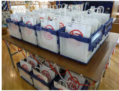
たくさんの福袋を準備！