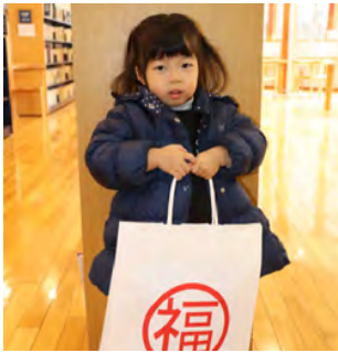
どんな本が入っているかな？