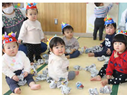
ひよこ組のみんなもお面をつけて豆まき