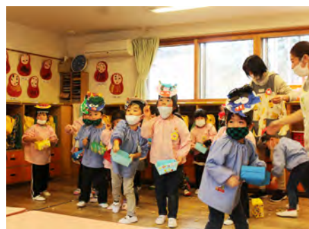
年少組さん、鬼に負けずに豆まき!

2月号は「節分の豆をまく前にするべきことは？」という問題でした。正解は、③窓や玄関を開けるでした。「鬼は外」の掛け声とともに豆をまきます。窓を開け窓から鬼を追い出し、追い出した鬼が戻らないよう窓を閉め、「福は内」と豆をまきましょう。奥の部屋からまいていき、最後に玄関でまいて豆まきを終わってから、福豆を食べて、1年間の厄を取り除きましょう。地域によっては、豆まきの方法や口上などが異なるので、興味のある方は調べてみてください。みなさん、正解できたかな？