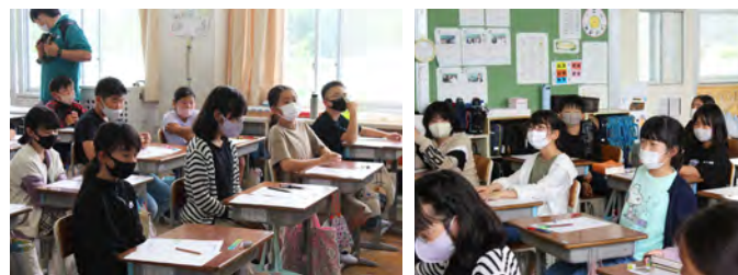
山口こうじ店による講座の様子(吉子川小学校5年生)