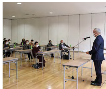
村長講話を熱心に聞き入る受講者

ラウン大学の規約・沿革の確認があり開講式を閉じました。開講式後、第1回講座として、学級生が毎年楽しみにしている恒例の村長講話が行われました。