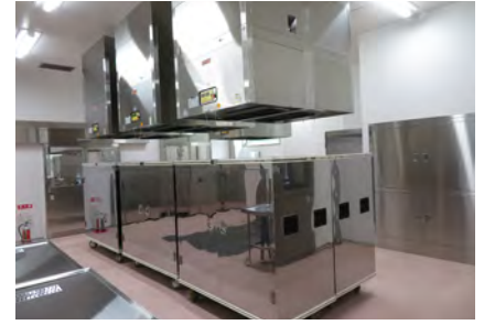
⑤⑨コンテナ室 県内でも数カ所しかない、コンテナの消毒を行える設備を導入しました。