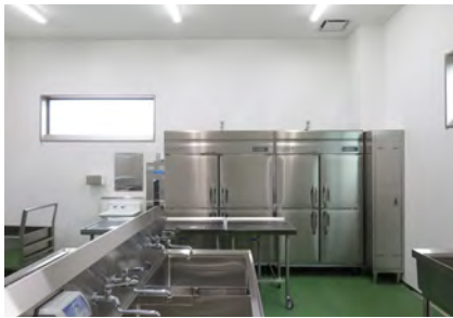
② 野菜果物下処理室 野菜や果物などを洗います