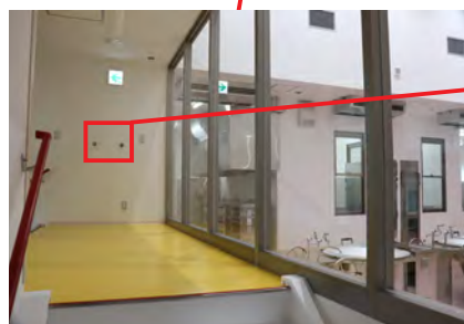
▶見学エリア 調理室の様子を見学できます。