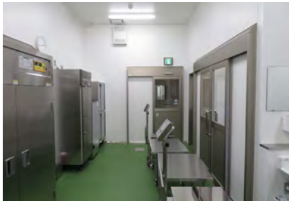
① 検収室 物資納入業者から食材を受け取ります。