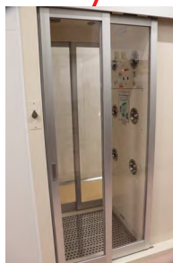
▶エアシャワー 清潔区域（調理室など）に入室する際に通ります。