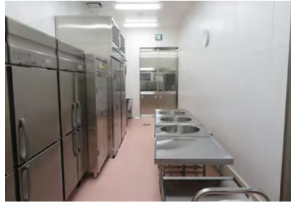
④和え物室 和え物などの食材を冷ます工程のある調理をします。