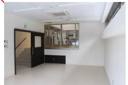
▶会議室 見学後、食育の授業などを行います。後日、机や椅子が搬入されました。