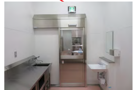
▶アレルギー食調理室 調理室の一角に独立した部屋として設置されています。