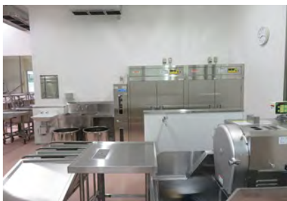
③ 野菜上処理室 野菜や果物などをカットします。