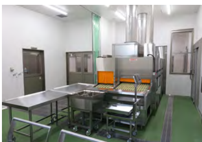
⑧ 洗浄室 回収した食器を機械で洗います。