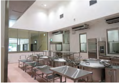
④調理室 電気回転釜などで煮炊き、炒め物、汁物の調理をします。