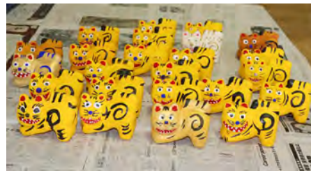
個性あふれる作品が並んだ張り子の虎

ないとの説明を受け、学級生達は、基本的な柄を模しながらも随所に自分なりの工夫を取り入れて、思い思いの作品を制作していました。