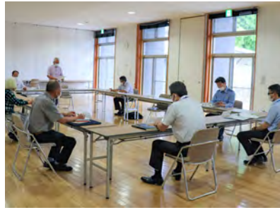
熱心な協議を行う委員の方々

「普通の子どもが巻き込まれる」のがネット犯罪の怖い点です。子ども達を守るために、各家庭でルール作りをし、メディアコントロールを推進していくことが大切です。