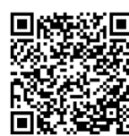
中島村防災・災害情報アプリ (Google play)