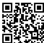
中島村登録制メール