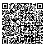
中島村防災・災害情報アプリ (App Store)