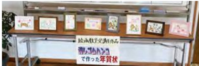
ロビー展示された消しゴムはんこ作品

しゴムに型を彫り、異なる色のインクで押しついたり、グラデーションがつけられる専用のスタンプ台を使ったりして様々な変化をつけることができます。今年、消しゴムはんこで年賀状作りを行いました。