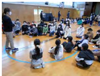
▲担当教師からの説明を受ける様子

2月に入ると、清掃班や登校班なども引継ぎが行われます。進級へ向けた準備が着々と進んでいます。