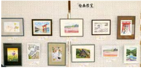
文化祭に出品した大人の塗り絵作品

文化祭前までは「大人の塗り絵」制作を行っています。「大人の塗り絵」は、今や大人気で、浮世絵や子守歌の風景など様々なシリーズが発行されています。お手本を見ながら忠実にそれを再現していくのが、大人の塗り絵の醍醐味。教室中は皆、時が経つのを忘れるほど集中していて、まさに「無」の境地です。