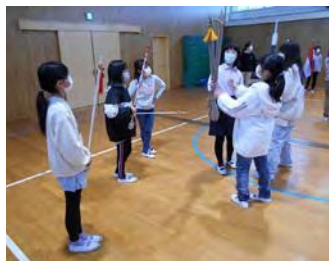
▼指揮担当の子どもたちの様子