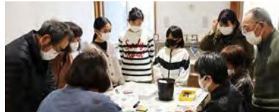
手順を熱心に聞く受講者

のいく仕上がりとになりました。額装すると一段と見栄えもよくなり、文化祭には、素晴らしい作品が出品できました。半年以上かけて取り組んできた作品は、「大人の塗り絵コンテスト」にも出品し、