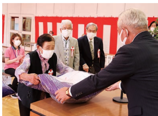
米寿の記念品を受けとる出席者