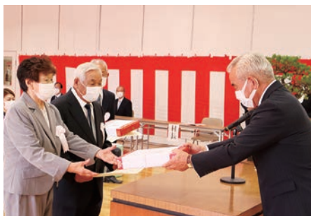
ダイヤモンド婚表彰ご夫妻