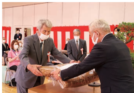
長寿(80歳) 出席者へ記念品贈呈