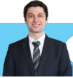
ニック先生の 英語教室