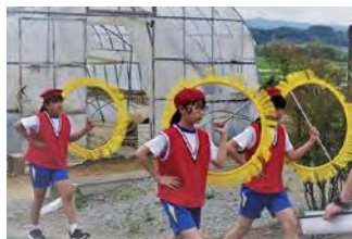
交通安全・防犯鼓笛パレードの様子