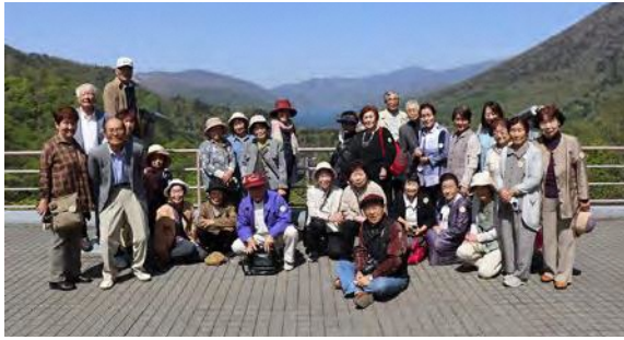
最高の天気の中、絶景の明智平での一枚

クラウン大学県外研修旅行は、5月17日(水)実に4年ぶりに実施されました。今回の旅行は、奥日光の三大名瀑を巡る旅。華厳の滝は明智平からの見学で、中禅寺湖、華厳の滝、男体山がいつぱんに見渡せるまさに絶景スポットでした。竜頭の滝、湯滝も、それぞれ個性のある見応えのある滝でした。お昼には日光名物ゆば料理を堪能し、最高の天気恵まれ、最高の眺望をたっぷり味わった1日となりました。