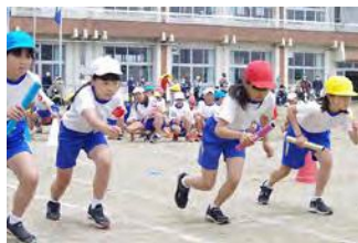
運動会の様子（上学年リレー）

地域の方々のご支援やご協力の中で学校は運営されています。まさに、地域とともに歩む学校、地域と一緒に育てる学校といえます。今後も地域に根ざした学校をコンセプトとして展開してまいります。