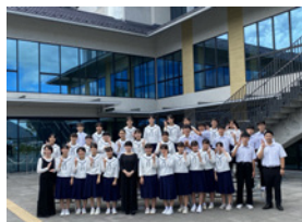
合唱コンクールにて

2学期はききょう祭などの文化的な行事がたくさんあります。今後の生徒達の活躍にご期待ください。