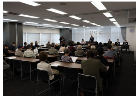
総会に参加する東京なかじま会会員

みなさんの協力のもと頑張っていきたい。ふるさとをいつも誇りに思っています。」と挨拶がありました。