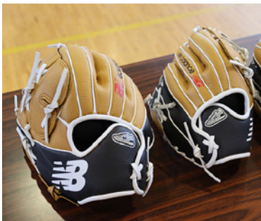
右利き用グローブと左利き用グローブ