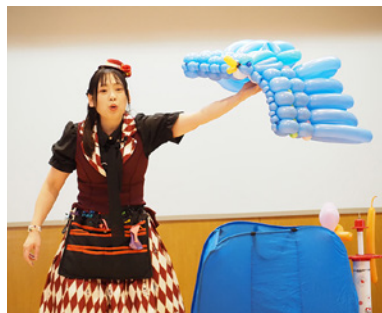
歌って踊ってバルーンを作成

親子で楽しむ歌と風船遊び「風船の国のアリスのバルーンショー」をテーマに楽しみました。