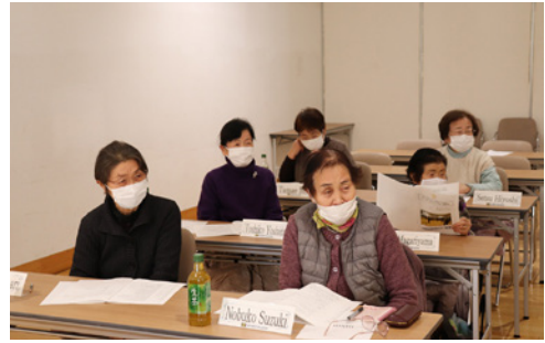
熱心に話を聞く受講者の皆さん