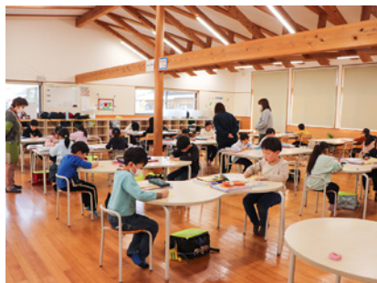
一生懸命勉強に取り組めます

6月より開始した小学生対象の金曜日学習支援が2月16日(金)をもって令和5年度は終了となりました。1・2年生、3年生以上ともに一生懸命学習に取り組むことができました。また、2月24日(土)には中学3年生対象土曜学習会も最終講義となりました。