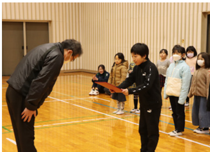
閉級式 修了証授与

また、運動会の後には閉級式を行い、スライドショーで1年間の活動を振り返り、会員1人ずつ感想の発表を行いました。冬の運動会と閉級式をもちまして、中島ジュニアクラブ令和5年度の活動が終了しました。ジュニアクラブでは次年度も様々な事業の実施を計画しております。みなさまのご参加をお待ちしております。