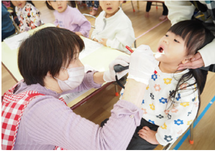
しっかり歯磨きできているかな？