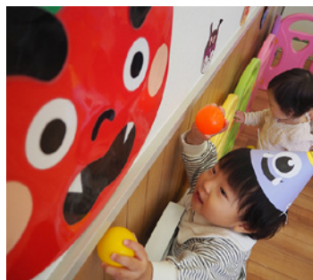
鬼さん怖くないぞ!

節分についてのお話を聞いた後、園児は「鬼のパンツ」を歌い、クラスごとに豆まきを行いました。