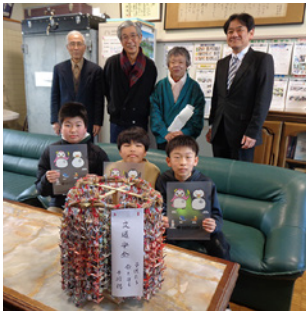
安全を願って作られた千羽鶴