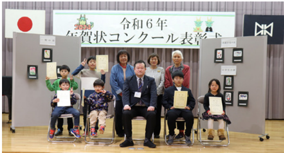
受賞者のみなさん