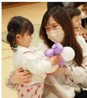
プレゼントもらったよ!