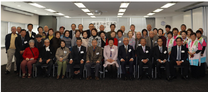
東京なかじま会会員と村からの参加者