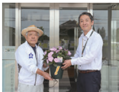
水野谷滑津原行政区長（左）、橋本副村長（右）