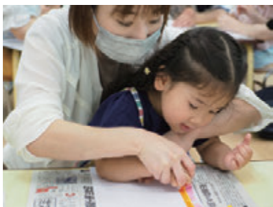
どんなお願いをしようかな?