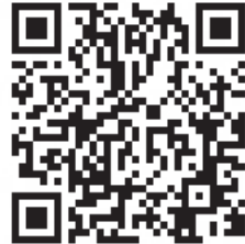
救急車利用リーフレット