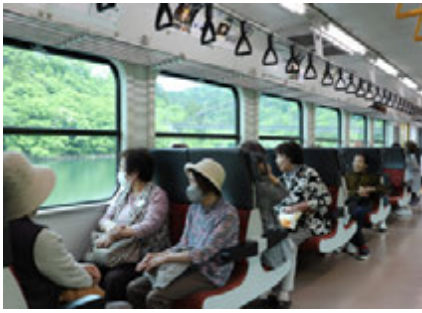
車窓から只見線の新緑を楽しむ受講生

5月15日(水)五月晴れの空の下、クラウン大学県内研修旅行が行われました。今回は2年前に行って好評だった「只見線乗車の旅」の2回目です。前回は再開通間もない頃で、ぎゅうぎゅう詰め乗車となっていました。そこで今回は、会津川口駅始発の電車を選び、全員ゆつくり座って、車窓からの新緑や、只見川の雄大な景色を楽しむことができました。