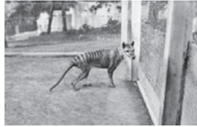
Image link https://www.nytimes.com/2023/04/07/science/tasmanian-tiger-sightings.html

タスマニアタイガーは、かつてオーストラリアのタスマニア島に生息し、今はもう絶滅した肉食有袋類です。背中にトラのような縞模様を持つ大型犬に似たこの動物は、今までに生息した動物の中で最大の肉食有袋類でした。犬のような外見にもかかわらず、カンガルーと同じ有袋類でした。タスマニアタイガーは絶滅したにもかかわらず、多数の未確認の目撃情報や生存の噂により、オーストラリア文化の中でイエティ※1やビッグフット※2と同様に伝説的な動物となっています。