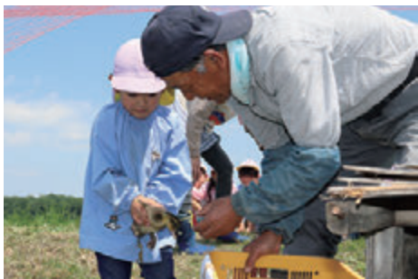
元気にいってらっしゃい！

5月22日（水）吉子川小学校の4～6年生47名と村交通安全対策協議会・村交通安全協会・村交通安全母の会・村パトロール隊・村防犯協会・村議会議員・学校関係者が参加し、交通安全・防犯パレードが行われました。 沿道、生涯学習センター輝ら里には、児童の元気な演奏を聴こうと保護者や地域のみなさんが駆けつけてくれました。