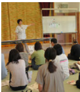
歯を大切にしましょう