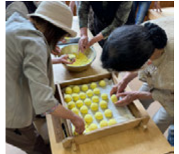
思ったより形よくできました

会津柳津駅までの約1時間の乗車を楽しんだ後は、小池菓子舗の指導により「あわまんじゅうつくり体験」を行い