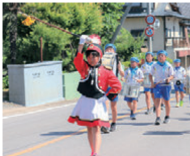
事故には気をつけましょう